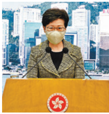
林鄭月娥指事件非所謂「民主人士受到鎮壓」。

12名「獨暴」分子早前潛逃離港，於內地海域被廣東海警截獲，因涉嫌偷越國（邊）境犯罪，已被依法採取刑事拘留強制措施。行政長官林鄭月娥昨日在行政會議前的記者會上指出，事件的本質是12人畏罪潛逃，以逃避法律責任，並非如本地或外國人等形容的「民主人士受到鎮壓」。有關人等於內地犯法，由內地司法機關處理是恰當的做法。在另5名港人被台灣扣押一事上，林鄭月娥質疑，社會上某些人對於這兩批人可能有點雙重標準。 香港文匯報記者 鄭治祖