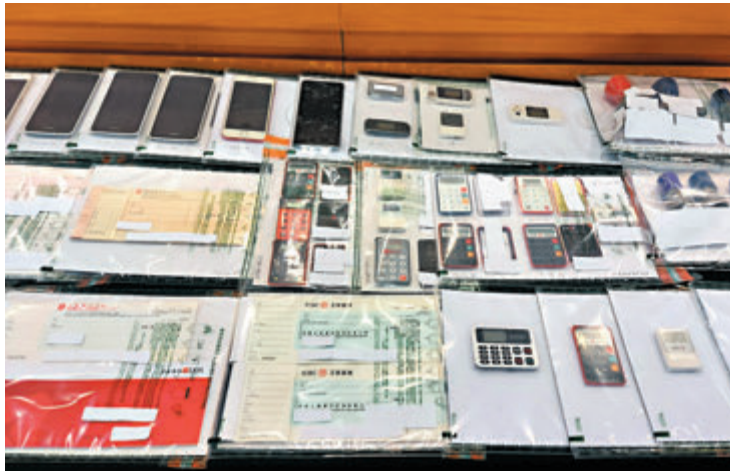
▲海關行動中檢獲電腦、手提電話、大量保安編號及銀行月結單等證物。