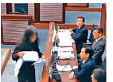
▲長毛在立法會搶文件案須發還裁判法院排期重審。資料圖片

潘官引述上訴庭在今年6月的書面判詞中所指，《立法會(權力及特權)條例》第十七(c)條指：「凡任何人在立法會舉行會議時，引起或參加任何擾亂，致令立法會的會議程序相當可能中斷，即屬犯罪」，當中「任何人」並非豁免立法會議員，故裁定藐視立法會罪必然適用於控告