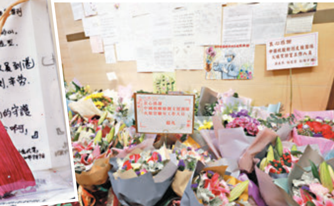
慰問支援隊的心意卡、花束等。