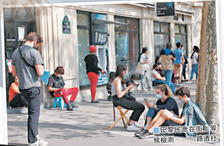
■ 巴黎民眾在街上等候檢測。

CDC的公共衛生專家在疫情期間，每周撰寫《發病率及死亡率週報》(MMWR)，供科學家參考，被視為最權威的公共衛生通報，內容在發表前屬機密，即使是衛生部和疾控中心其他官員，亦只能預先得悉短一段的摘錄。