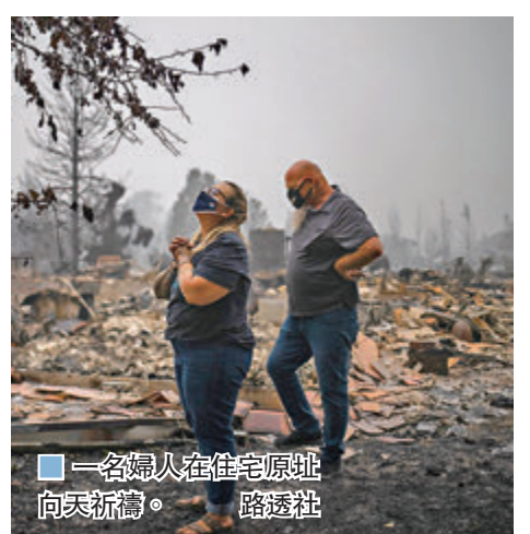
■ 一名婦人在住宅原址向天祈禱。

美國西岸的山火繼續焚燒，累計造成至少28人死亡，加州、俄勒岡州和華盛頓州均被山火引發的濃煙籠罩。瑞士空氣質量監測公司IQAir統計，前日全球空氣污染指數最高的5個城市，全部位於美國西岸，從洛杉磯至加拿大溫哥華的天空，均滿布濃煙和灰燼。總統特朗普今日會到訪加州，聽取當地官員匯報災情。