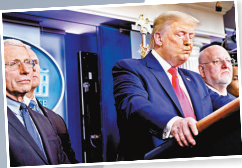
▲ 特朗普2月主持疫情發布會。

美國總統特朗普頻頻聲稱新冠疫情「已經受控」，並急於通過未經實證的療法和疫苗，以盡早重新展開經濟活動。《華盛頓郵報》報道，衛生與公共服務部(HHS)顧問亞歷山大，近期多次試圖插手疾病控制與預防中心(CDC)工作，要求修改及延後發表一些與特朗普主張不符的疫情報告，甚至聲稱疾控中心專家有意發表誤導報告打擊特朗普。