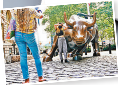
■ 美國政府不惜延誤資訊發布以求解封。