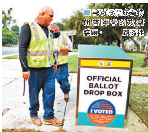
■ 郵寄投票成為特朗普陣營的攻擊議題。