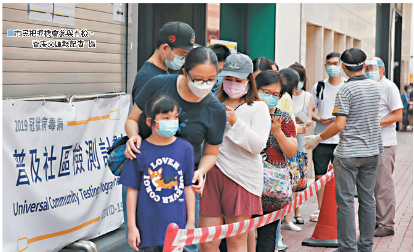
市民把握機會參與普檢。

聶德權昨晨預測，整個普檢計劃「埋單」有170萬人參與。但昨晚政府公布全日普檢統計時，已超乎聶德權的預測，由本月1日至昨晚8時，累計有171.9萬人已經採樣，完成化驗的數目則有約166.7萬個，暫時找出26宗確診個案，陽性比率為0.000016。該計劃下的社區檢測中心數量雖然已經由計劃開始初期的141間減至57間，但昨日全日仍有約5.3萬人「趕尾班車」接受檢測，平均每間中心為約930人採樣，數字較計劃開展首日每間中心平均約894人採樣為多。聶德權透露，逾兩成6歲以上市民均已接受普檢。他解釋，計劃找出的個案不多與疫情緩和的趨勢吻合，反映第三波疫情進入尾聲，有助政府了解社區感染情況，及早將患者隔離，已經達到推行檢測的目標。