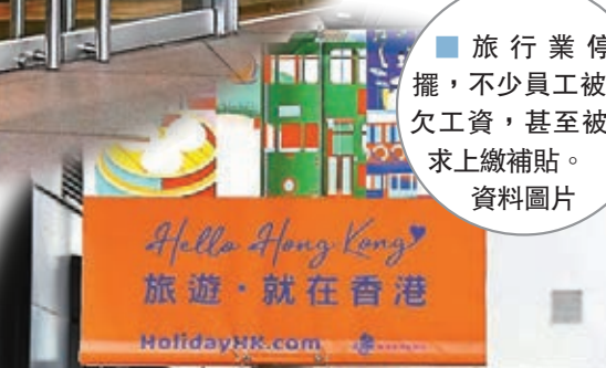
■旅行業停擺，不少員工被拖欠工資，甚至被要求上繳補貼。資料圖片