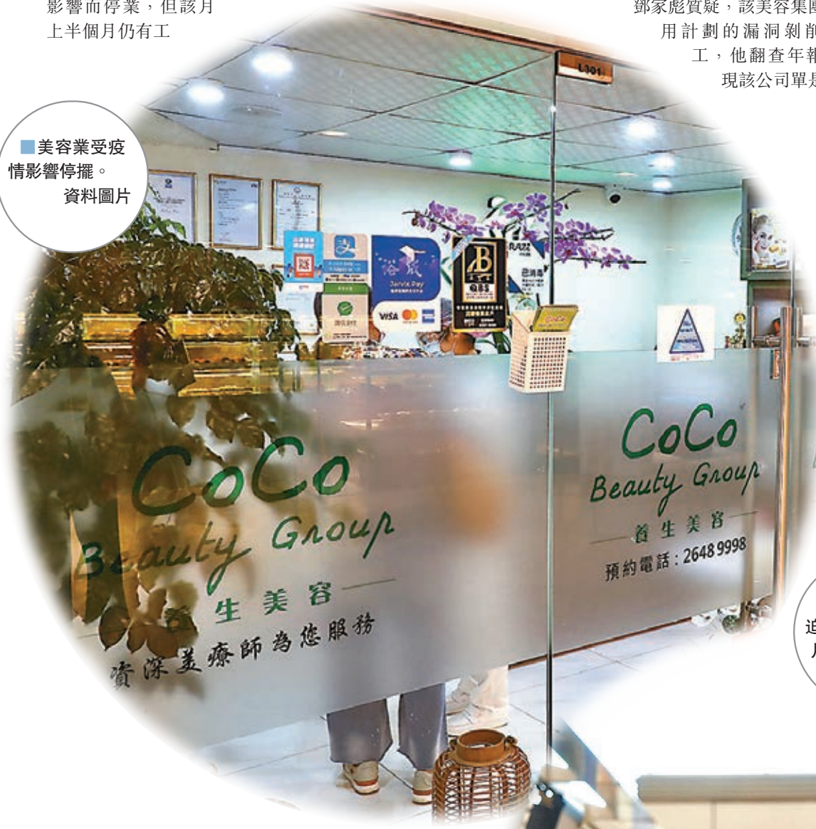
■美容業受疫情影響停擺。資料圖片

他指出，不少求助人士反映旅行社要求與導遊及領隊「瓜分」補助金才願意蓋印，「例如每月5,000元要『上繳』1,000元，不合規矩？當然不會白紙黑字寫明，只是『你情我願』！如果不答應，隨時一蚊都攞唔到，或者以後被旅行社列入『黑名單』無得帶團，因此只能敢怒不敢言！」