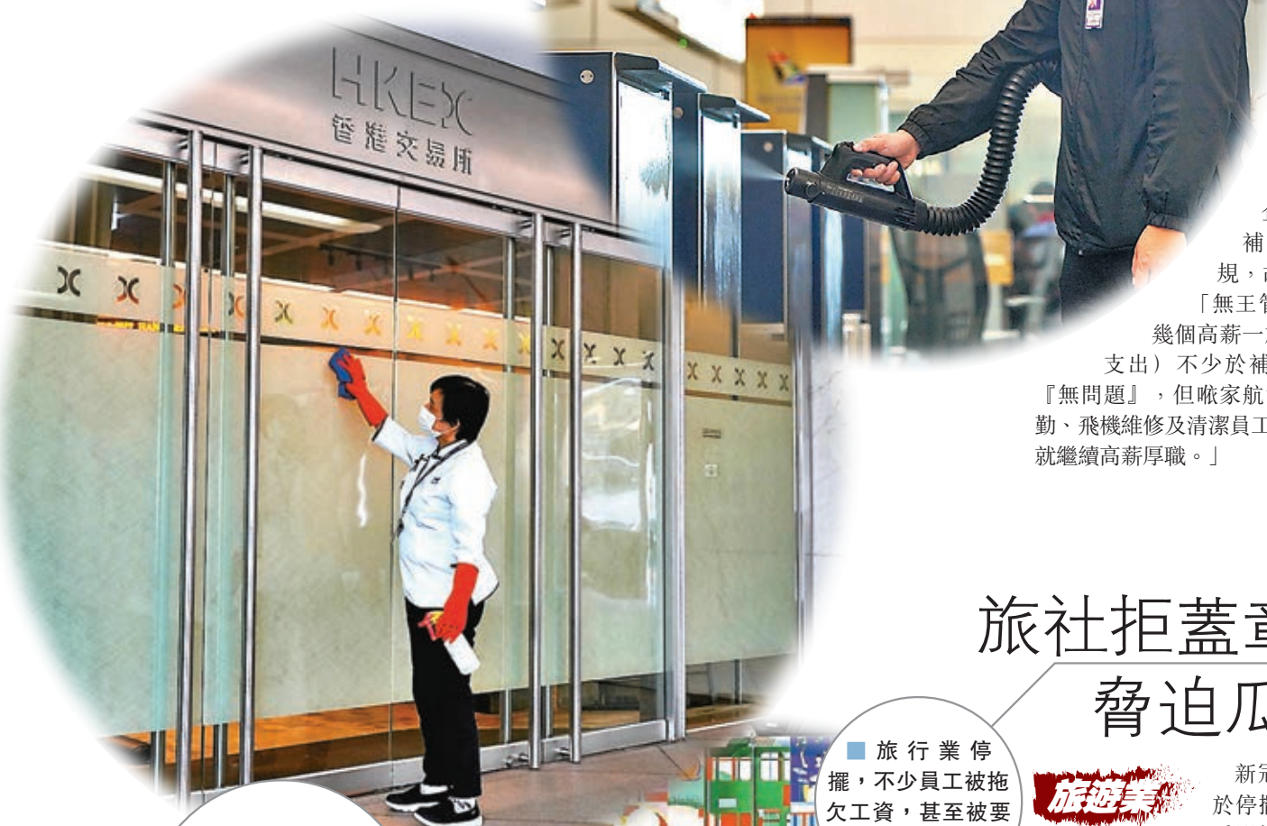
■機場員工被迫放無薪假，每月收入大減。