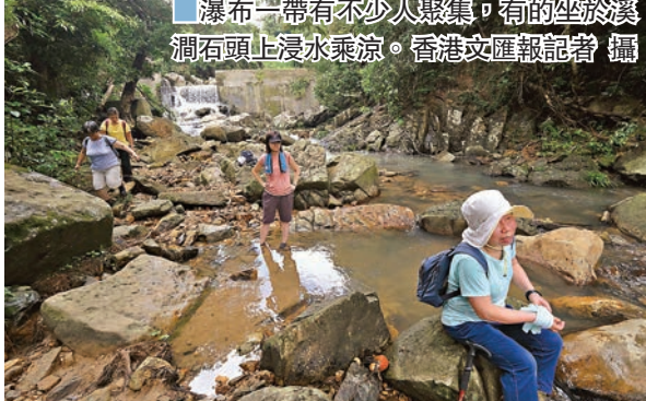
瀑布一帶有不少人聚集，有的坐於溪澗石頭上浸水乘涼。