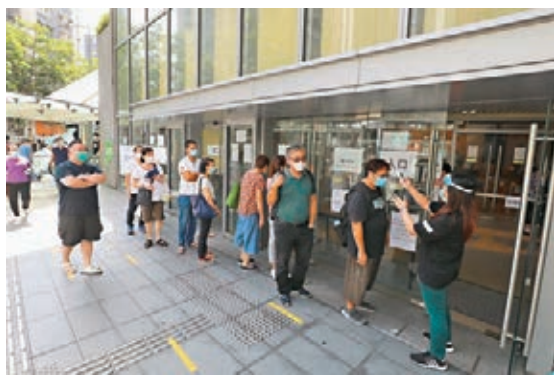
個案4933及4935送院前參與普檢，但未有結果前已被送院進行病毒測試並確診。資料圖片