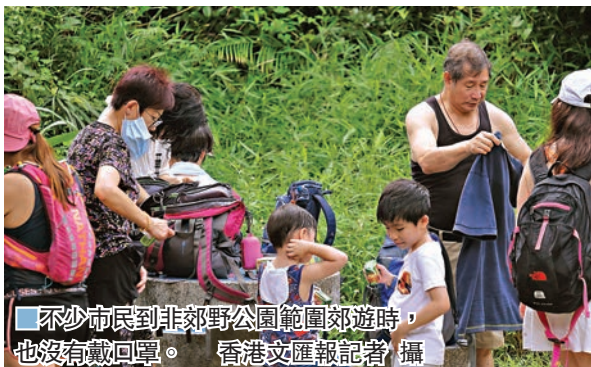
不少市民到非郊野公園範圍郊遊時，也沒有戴口罩。