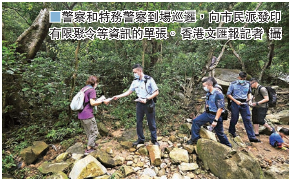
警察和特務警察到場巡邏，向市民派發印有限聚令等資訊的單張。