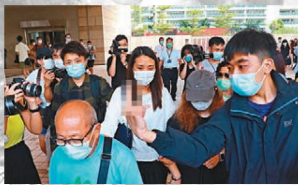
攬炒派中人的「Lunch仔」滋擾陳彥霖家屬，更公然豎起粗口手勢。資料圖片