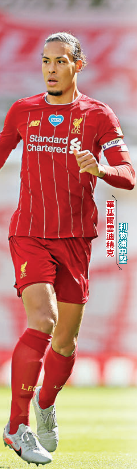
華基爾雲迪積克 利物浦中堅