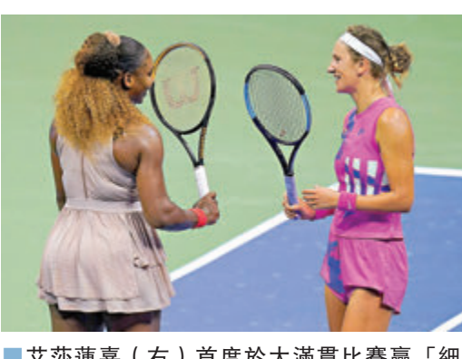
艾莎蓮嘉（右）首度於大滿貫比賽贏「細威」。

香港文匯報訊（記者 楊浩然）本屆美國網球公開賽女單決賽戲碼已經出爐，將由白俄羅斯的3號種子艾莎蓮嘉對戰2018年冠軍大坂直美；兩人分別淘汰「細威」莎蓮娜威廉絲和美國球手比妮迪殺入最終決賽。 作為2018年冠軍和4號種子的大坂直美，對手是首次殺入大滿貫賽事4強的主場球手比妮迪，結果大坂直美雖然一度被追和盤數1:1，但最終再贏一盤6:3，以2:1殺入決賽。 兩位媽媽級球手艾莎蓮嘉和莎蓮娜威廉絲在另一場準決賽相遇，前者過往在大滿貫賽事從未贏過「細威」，在首盤大敗1:6下，更似是大勢已去；然而艾莎蓮嘉在第二盤起終於甦醒，加上「細威」可能曾因左腳扭傷受傷場影響表現，最終艾莎蓮嘉連贏兩盤6:3，以2:1反勝對手殺入決賽。 落敗的「細威」賽後分析了敗因：「我犯了很多失