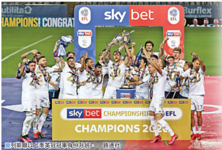
列斯聯以上季英冠冠軍身份升班。

上季一放絕塵首奪英超冠軍，不過利物浦今季要重溫好夢難度相當大，曼市雙雄及車路士等主要爭標對手人腳大幅增強，未有重磅收購的「紅軍」唯有在戰術上做文章，希望拿比基達及南野拓實能夠加強中路進攻，面對由「狂人」比爾沙帶領的列斯聯，高洛普的執教功力將在今場備受考驗。 (now611及621台周日0:30a.m.直播) ■香港文匯報記者 郭正謙