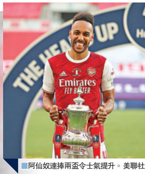
阿仙奴連捧兩盃令士氣提升。