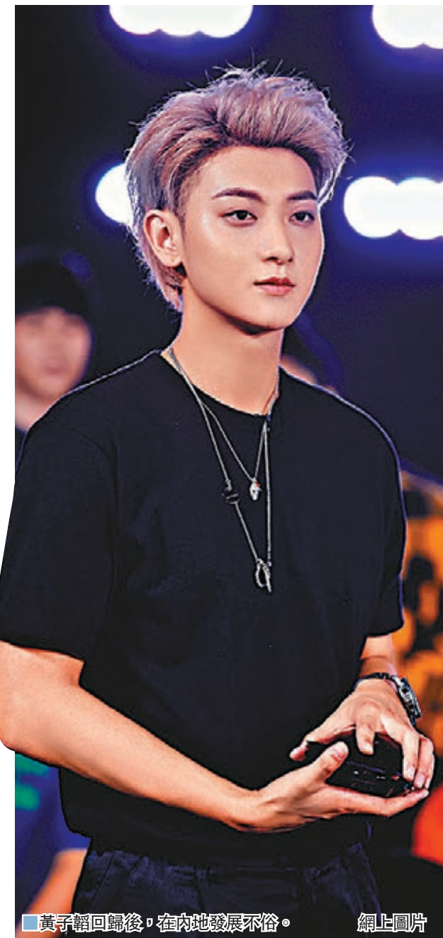
黃子韜回國後，在內地發展不俗。

香港文匯報訊（記者 文芬）內地男歌手、演員黃子韜的父親、龍韜娛樂創始人兼執行董事黃忠東昨日病逝，終年52歲。黃子韜曾是韓國SM旗下藝人，與父親關係密切，幾年前黃忠東受訪透露，自己在青海有四五套房子、200多億人民幣資產的公司，一度登上青海財富榜第7名。而這些豐厚資產由黃子韜承繼。