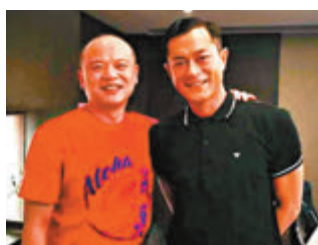
黃子韜父親曾與古天樂合照。