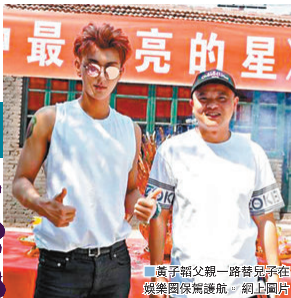
黃子韜父親一路替兒子在娛樂圈保駕護航。

黃爸爸把逾200億人民幣資產留給黃子韜，這確是一筆很大的資產。不過，對於黃子韜來說，爸爸留下最大的財富，就是做人的道理和拚搏的精神。黃子韜的爸爸也是白手起家，一步步做大了企業。如今黃子韜已經晉身一線巨星，也是付出了巨大的努力。