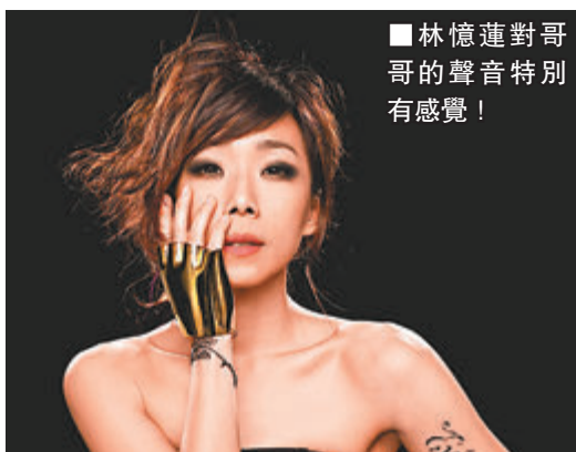
林憶蓮對哥哥的聲音特別有感覺！