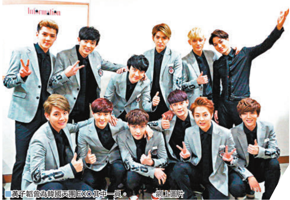
黃子韜為韓國天團EXO其中一員。