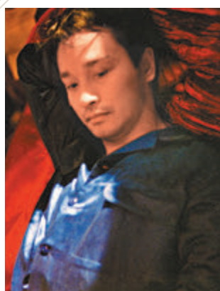
一代巨星張國榮，無論春夏秋冬，都是耐人尋味。