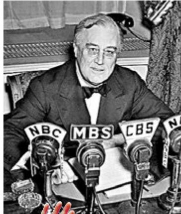
■ 特朗普借邱吉爾(左圖)及羅斯福(右圖)言論，企圖掩蓋自己淡化疫情的事實。