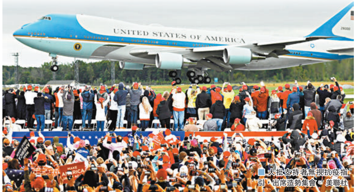
■ 大批支持者無視防疫指引，出席造勢集會。

特朗普前日在白宮記者會上，被記者問及「你為什麼向美國民眾說謊？」特朗普馬上反駁稱「我沒有說謊」，又解釋自己「不想跳上跳下尖叫着『死了人！死了人！』」