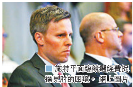
■ 施特平面臨競選經費捉襟見肘的困境。

他們也難以爭取支持。自上月10至本月7日，拜登陣營已在電視廣告花費約9,000萬美元(約7億港元)，是特朗普陣營同類開支1,800萬美元(約1.4億港元)的5倍。由於拜登在密歇根州和佛羅里達州等關鍵搖擺州份，鋪天蓋地投放電視廣告，不但令共和黨金主見狀後不滿，頻頻向共和黨人投訴，亦使共和黨全國委員會主席麥克丹尼爾感到憂慮。