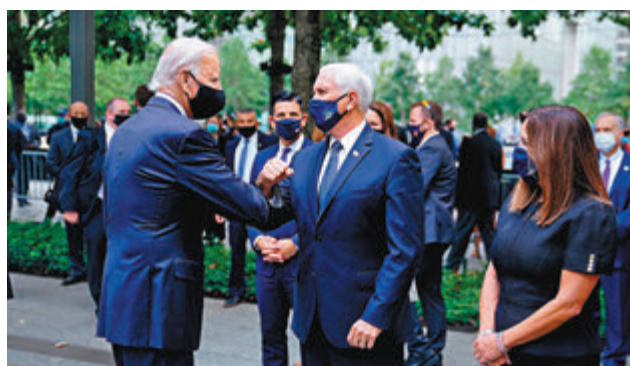
■ 拜登(左前)與彭斯(中)碰面，兩人互碰手肘問好。

在昨日美國「911」恐襲19周年，遇襲的紐約世貿中心遺址、第4架客機墜毀地點尚克斯維爾等地均舉行悼念儀式，不過因新冠疫情，規模有所縮減。總統特朗普及民主黨總統候選人拜登均出席悼念活動，不過未有碰面。