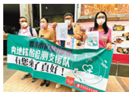
■團體「香港政研會玫瑰團」感謝內地核酸檢測支援隊。

香港政研會向支援隊送上的感謝信寫到：「感謝內地支援隊不辭辛勞為香港市民提供專業服務，感恩致謝，沒齒難忘。」發言人鄧先生指前幾日就收集了逾50張市民心意