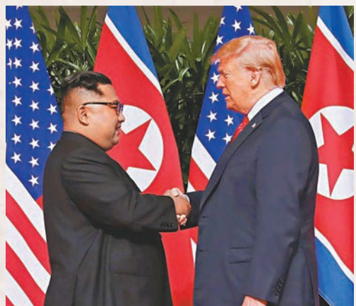
金正恩表示難忘與特朗普握手。資料圖片