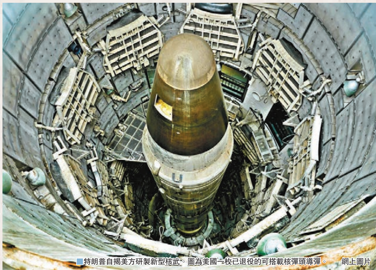
特朗普自揭美方研製新型核武。圖為美國一枚已退役的可搭載核彈頭導彈。