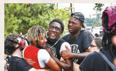
特朗普表示無責任理解非裔的痛苦。

伍德沃德在新書中提到曾與總統特朗普談及近期在美國各地爆發的反種族歧視示威，伍德沃德問特朗普：「是否有責任理解非裔社群的