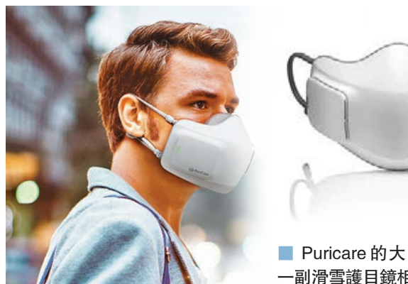
Puricare的大小和重量與一副滑雪護目鏡相若。

參與研究的新加坡科技研究局材料與工程學院院長羅賢俊表示，染疫病人在隔離病房時，前線醫護每隔約30分鐘便要進入病房，記錄病人皮膚溫度及血氧含量數值，以監測他們的生命跡象。智能口罩利用3個感應器整合的一枚晶片，並添加藍牙功能，資料能即時傳到智能手機，病人戴上這款口罩後，醫護便可遙距監測患者情況，降低感染風險。