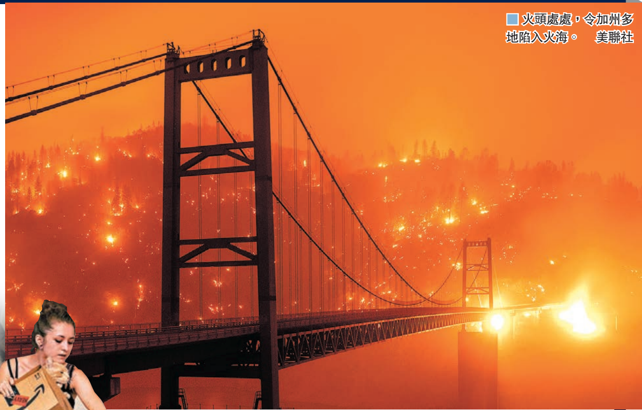
火頭處處，令加州多地陷入火海。

俄勒岡州的山火同樣非常猛烈，至少有35場大火，在時速80公里的強風下，火勢持續蔓延，至少5個縣被大火吞噬，馬里恩縣一名12歲男童及其祖母遇難，傑克遜縣亦有一人死亡。州長布朗表示，今次是當地歷來最嚴重山火，預計將造成重大人命和財物損失。有居民匆匆駕車逃生，形容情景「恍如地獄」。華盛頓州部分城鎮被大火摧毀，一名1歲男童逃生期間不幸遇難，其父母3級燒傷，被送院救治。氣象專家預計在強風帶動下，山火將繼續向內陸地區蔓延。