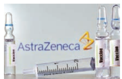
阿斯利康下周或重啟實驗。

英國藥廠阿斯利康因一名參與測試新冠疫苗人士疑出現嚴重不良反應，周二宣布暫停相關實驗，等待獨立委員會重新檢視數據。據英國《金融時報》報道，阿斯利康或於下周重啟實驗，消息刺激阿斯利康股價前日止跌回升，收市升0.5%。阿斯利康行政總裁索里奧特昨日表示，若可於短期內重啟測試，有望在今年年底前確認疫苗效用。