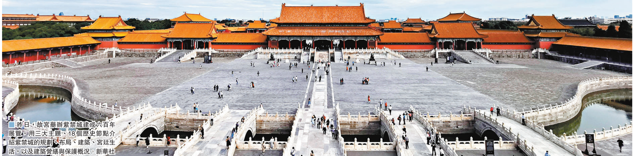
昨日，故宮舉辦紫禁城建成六百年展覽，用三大主題、18個歷史節點介紹紫禁城的規劃、布局、建築、宮廷生活，以及建築營繕與保護概況。新華社