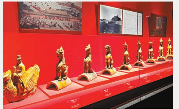
太和殿脊獸 十隻脊獸包括龍、鳳、獅子、海馬、天馬、押魚、獬豸、狻猊、斗牛和行什，象徵皇權至高無上。牠們由仙人領隊領頭依次排列。古代屋頂上脊獸最高品階為九隻，而太和殿則多加了一隻行什，成為整個中國古代建築中最獨特的形式。