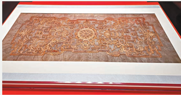
符望閣南間描金銀漆紗 1773年，南方匠人們織造了十餘片漆紗，送入紫禁城。其中一件原先鑲嵌在寧壽宮花園符望閣一層的欄杆罩上，由紗芯層、紙樣層、貼金層、打底層、暈染層和勾線層六層組成，能完全透光，精美異常，至今難以原樣複製。