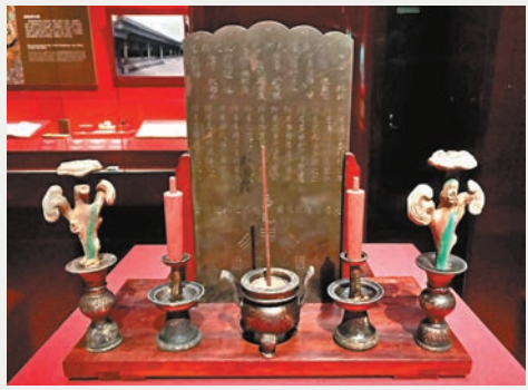
養心殿符板和五供 銅質符板上刻鑲宅靈符來守護宮室，前置香爐、蠟台、靈芝五供，放置於養心殿明間樑架內藻井正上方。整座紫禁城只有三座安放符板的建築，分別是太和殿、乾清宮和養心殿。