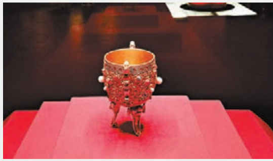
金甌永固杯 杯口邊鑄有「金甌永固」「乾隆年制」篆書，通體鑲刻繡枝花卉，其上鑲嵌數十顆碩大珍珠，紅、藍寶石和粉色碧璽。杯身的左右兩側各有一條向上奔騰的夔龍，代表着生機與威嚴。寓意大清的疆土、政權永固，是清代皇帝在每年元旦舉行開筆儀式時的專用酒杯。