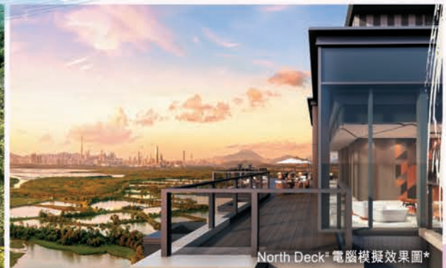
North Deck 29 電腦模擬效果圖 31

發展項目期數名稱：Wetland Lot No.34 Development發展項目(「發展項目」)的第3期(「期數」)(期數中住宅發展項目的第1座、第7座、第8座及第9座稱為「Wetland Seasons Park」)區域：天水圍 期數的街道名稱及門牌號數：濕地公園路9號 32 。此臨時門牌號數有特定期數建成時確認。賣方就期數指定的互聯網網站的網址：www.wetlandseasonspark3.com.hk 賣方建議準買方閱有關樓說明書，以了解期數的資料。本廣告/宣傳資料內載列的相片、圖像、繪圖或素描顯示純屬畫家對有關發展項目的想像。有關相片、圖像、繪圖或素描並非按照比例繪畫及/或可能經過電腦修飾處理。準買家如欲了解發展項目的詳情，請參閱售樓說明書。賣方亦建議準買家到有關發展地盤作實地考察，以對該發展地盤、其周邊地區環境及附近的公共設施有較佳了解。