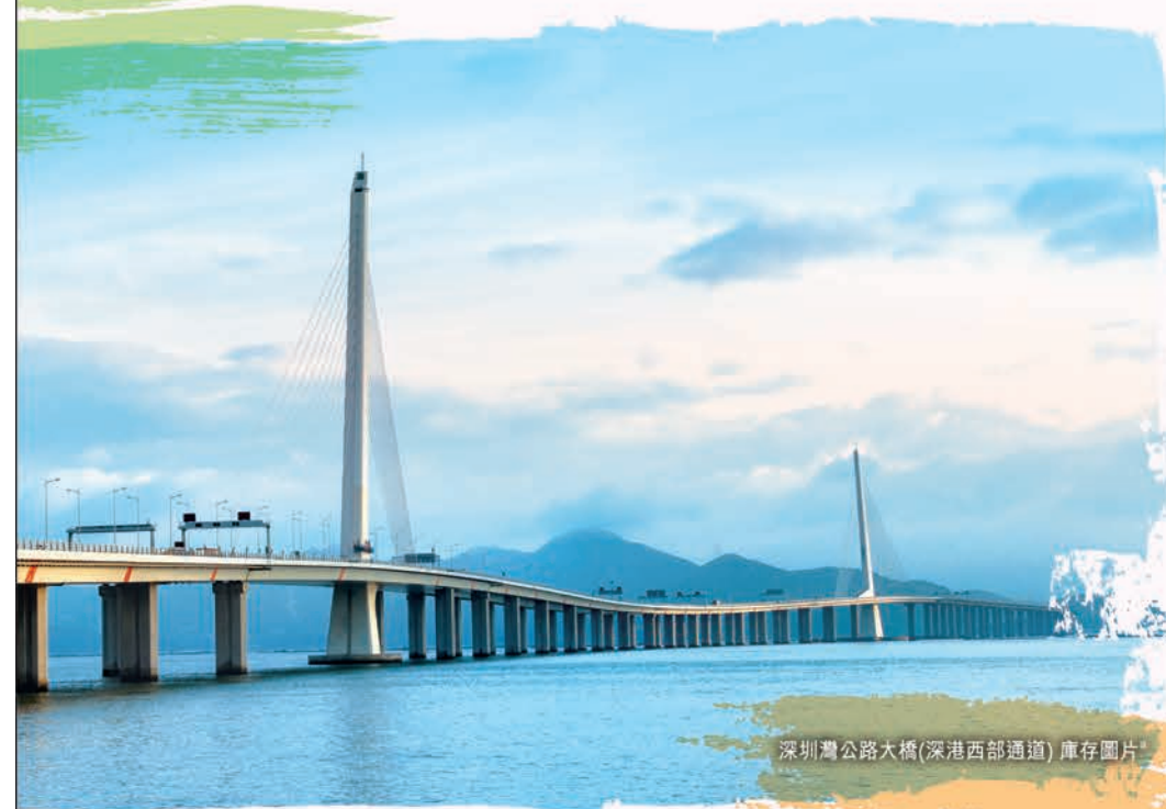
深圳灣公路大橋(深港西部通道) 庫存圖片