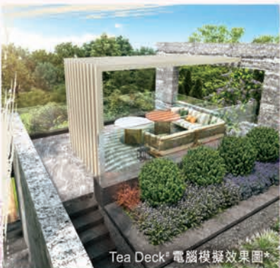
Tea Deck 29 電腦模擬效果圖 31

戶外閒樂設施 ：戶外配備大型園林，專設 Yoga Deck、Tea Deck、Coffee Deck 29 等露天休閒設施，住戶可一邊舒展品茗，一邊飽覽濕地美景 30 ，讓身心投入自然。