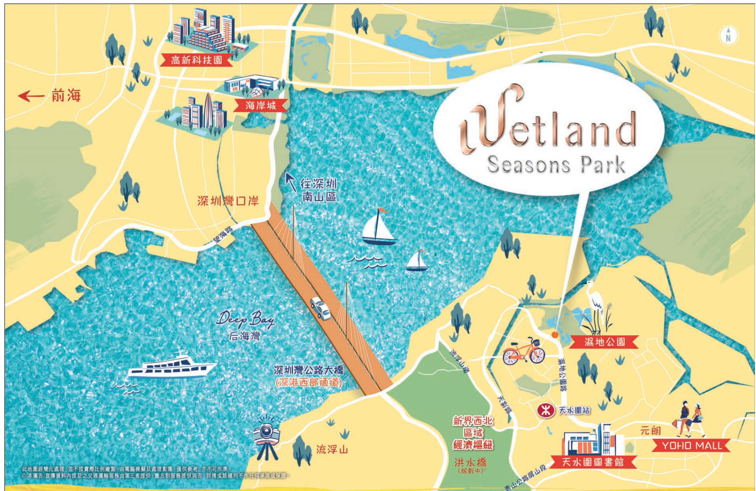
此地圖經電腦處理，並不按實際比例繪製，由電腦圖層及處理影像，僅供參考，亦不可作準。 ©本廣告/宣傳資料內提及之交通運輸服務由第三者提供，賣方對服務提供與否，詳情或路線均不作任何承諾或保證。