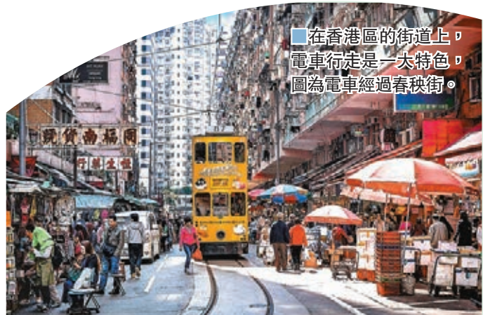
在香港區的街道上，電車行走是一大特色，圖為電車經過春秧街。