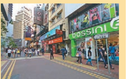
銅鑼灣啟超道上店舖時有變更

香港開埠初期，街道大多以英國的人名或地名命名，如砵甸乍街、堅尼地道、軒尼詩道等都是以港督的名字命名。19世紀後期，香港作為中國南部主要轉口港的地位確立。在這些街道中，如壽山道以英國統治時期首位華人議政局(後改稱香港行政會議)議員周壽臣命名。而20世紀初期，又有肇堅里以著名企業家、慈善家鄧肇堅命名，春秧街以「糖王」郭春秧命名等。在銅鑼灣，與啟超道緊鄰的白沙道取自原籍廣東新會的大儒陳獻章(世稱「白沙先生」)。