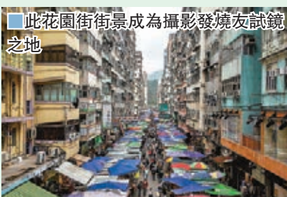
此花園街街景成為攝影發燒友試鏡之地

另一條位於深水埗的一條街道，俗稱鴨記的鴨寮街，以專售電子零件和電子產品而聞名，故有電子街或電子零件街的別稱，也成為不少遊客朝聖之地。