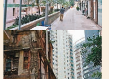
永利街是香港上環的一條街道，有九幢建於1950年代初的唐樓。