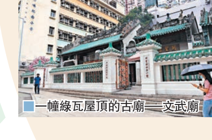
一幢綠瓦屋頂的古廟——文武廟