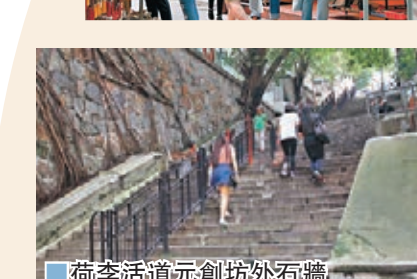
荷李活道元創坊外石牆為中央書院遺址