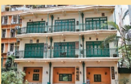
坐落於李節街的「灣仔大三元」