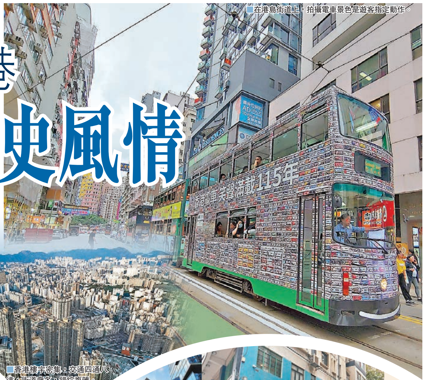
在港島街道上，拍攝電車景色是遊客指定動作。