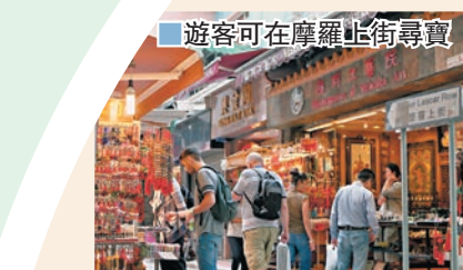
遊客可在摩羅上街尋寶