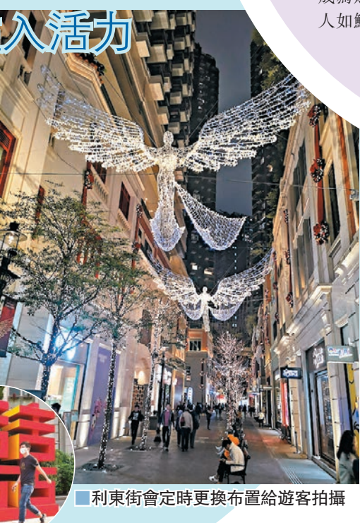
利東街會定時更換布置給遊客拍攝

雖然有些老街保留了歷史痕跡，但隨着時代變化，總有街道會消失，較為人熟知的相信是，昔日的喜帖街(鬮帖街)或印刷街現今變成了利東街，曾是香港著名印刷品製作及門市集中地，尤其以印刷喜帖著名。現在，這兒變身成全新長約200米的林蔭步行街，兩旁有露天茶座、品味創新的餐廳及本地和外國特色潮流品牌等，步行街上還不時轉換裝置，甚至長期張燈結彩，為傳統灣仔街道注入新活力，是成為灣仔南的景點之一。