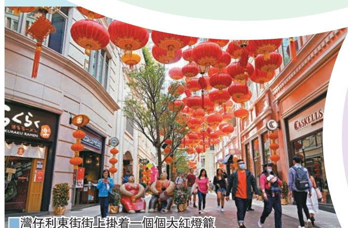
灣仔利東街街上掛着一個個大紅燈籠