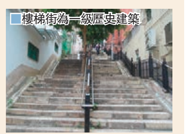
樓梯街為一級歷史建築