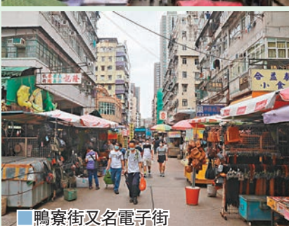
鴨寮街又名電子街