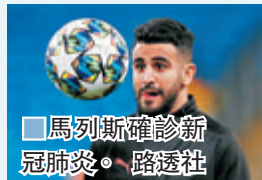
■馬列斯確診新冠肺炎。

無症狀。另一英超球會狼隊則宣布，以180萬英鎊從法甲里昂簽入31歲巴西左閘費蘭度馬卡爾。