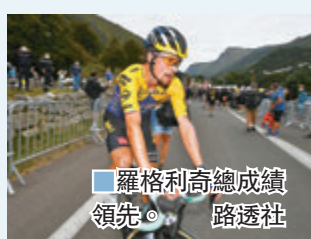
■羅格利奇總成績領先。

香港文匯報訊(記者楊浩然)本屆環法單車賽在6日完成第9賽段，比賽在比利牛斯山脈進行，起迄點為波城及拉魯斯，全長153公里。結果斯洛文尼亞選手波加查獲得此賽段冠軍，共同體羅格利奇獲得亞軍；羅格利奇賽後首度獲得象徵總成績榜第1的黃色戰衣，今場第4名的衛冕車手貝爾納則落後21秒排第2。