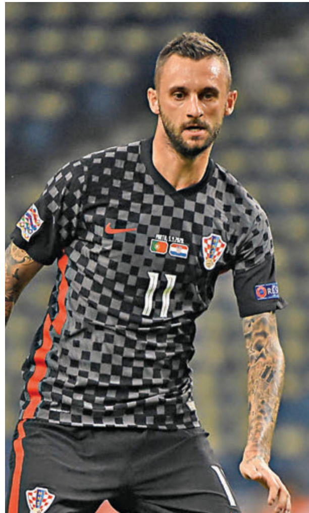
■克足中場波索域剛過去的意甲賽季，在國際米蘭隊中展現上佳狀態。