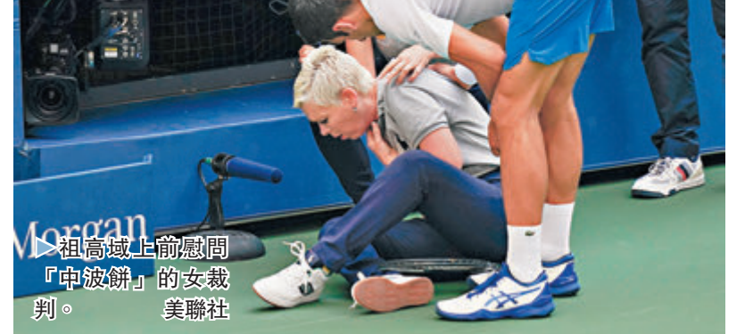
▶祖高域上前慰問「中波餅」的女裁判。