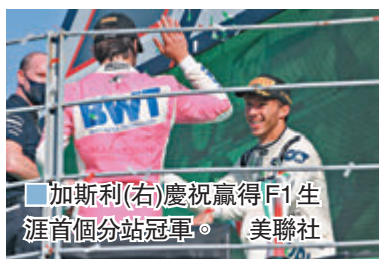
■加斯利(右)慶祝贏得F1生涯首個分站冠軍。

的他坦言喜出望外：「說實話，太難以置信了！我現在可能還沒反應過來，到底發生了什麼，這場比賽太瘋狂了，完全不懂怎樣去形容過去18個月發生的事！」