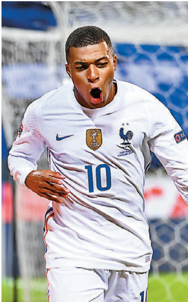
■麥巴比有望繼2018年世盃決賽，再次攻破克羅地亞的大門。

香港時間周三凌晨再有多場歐洲國家聯賽(歐國聯)上演，其中A級賽第3組(A3)法國將與克羅地亞合演2018年世界盃決賽翻版戰。然而，克羅地亞在今次賽期缺少兩大核心莫迪歷和拿傑迪錫壓陣，更要在作客環境下面對陣容較完整的法國，相信難當攔路虎。(香港國際財經76台，有線602、603及662台周三2:45a.m.直播) ■香港文匯報記者 楊浩然