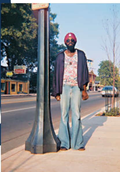
埃格爾斯頓為彩色攝影的先驅。

在數碼化的時代，無論是彩色、黑白，或是經過風格過濾的攝影圖片都並不罕見，只要按一下按鈕就能留住瞬間。然而，在上世紀大多數攝影師或者藝術家都單憑着一部菲林相機，用最純粹的視角記錄故事與景象，後來將這些碎片拼湊成一個時代的見證。1970年代，是黑白攝影與彩色攝影替換的時期，美國就有攝影師利用色彩，捕捉屬於自己當時眼前的點滴。 文：香港文匯報記者 陳苡楠