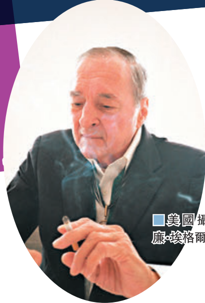
美國攝影師威廉·埃格爾斯頓。

在數碼化的時代，無論是彩色、黑白，或是經過風格過濾的攝影圖片都並不罕見，只要按一下按鈕就能留住瞬間。然而，在上世紀大多數攝影師或者藝術家都單憑着一部菲林相機，用最純粹的視角記錄故事與景象，後來將這些碎片拼湊成一個時代的見證。1970年代，是黑白攝影與彩色攝影替換的時期，美國就有攝影師利用色彩，捕捉屬於自己當時眼前的點滴。 文：香港文匯報記者 陳苡楠