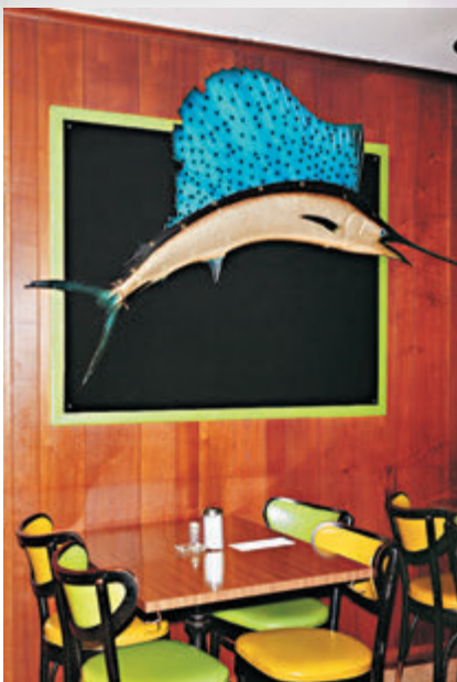
埃格爾斯頓的作品都捕捉了在那個年代的光景。