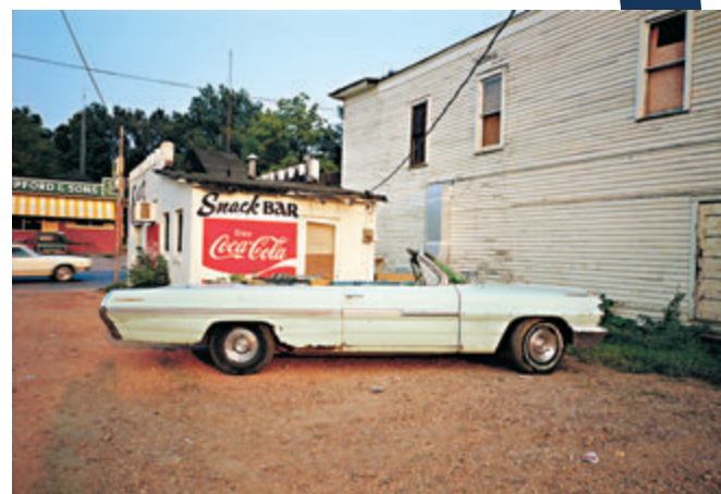
車成為埃格爾斯頓攝影的主題。