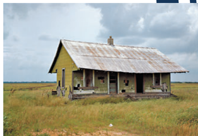
埃格爾斯頓是當時彩色攝影的先驅。