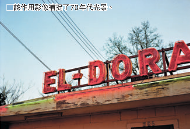
該作用影像捕捉了70年代光景。

《Untitled [Supermarket boy with carts]》是埃格爾斯頓在1965年攝於孟菲斯超級市場門外的一個作品，深刻地呈現了一個男孩推着手推車真實的瞬間，反映到當時的實況。雖然埃格爾斯頓的作品經常被批評為乏味和冷漠，與平日被定性為有趣味、超現實的作品觀感有截然不同的呈現，但是埃格爾斯頓卻在這些照片中找到了屬於自己彩色元素的發展空間。據了解，埃格爾斯頓提到自己對圖像沒有任何的偏好，同時認為攝影有一種圖像的民主個性，它們都是平等卻又迥然不同。繼手推車以後，車，成為了埃格爾斯頓主要拍攝的線索。在1965年到1974年之間，埃格爾斯頓另外一個策劃人登上了公路之旅，並完成了攝影生涯中最有名的系列。作品中，他呈現了車與人、車與公路、車與風景、車與加油站以及車與購物中心的連結，掃描各種美國的风景。