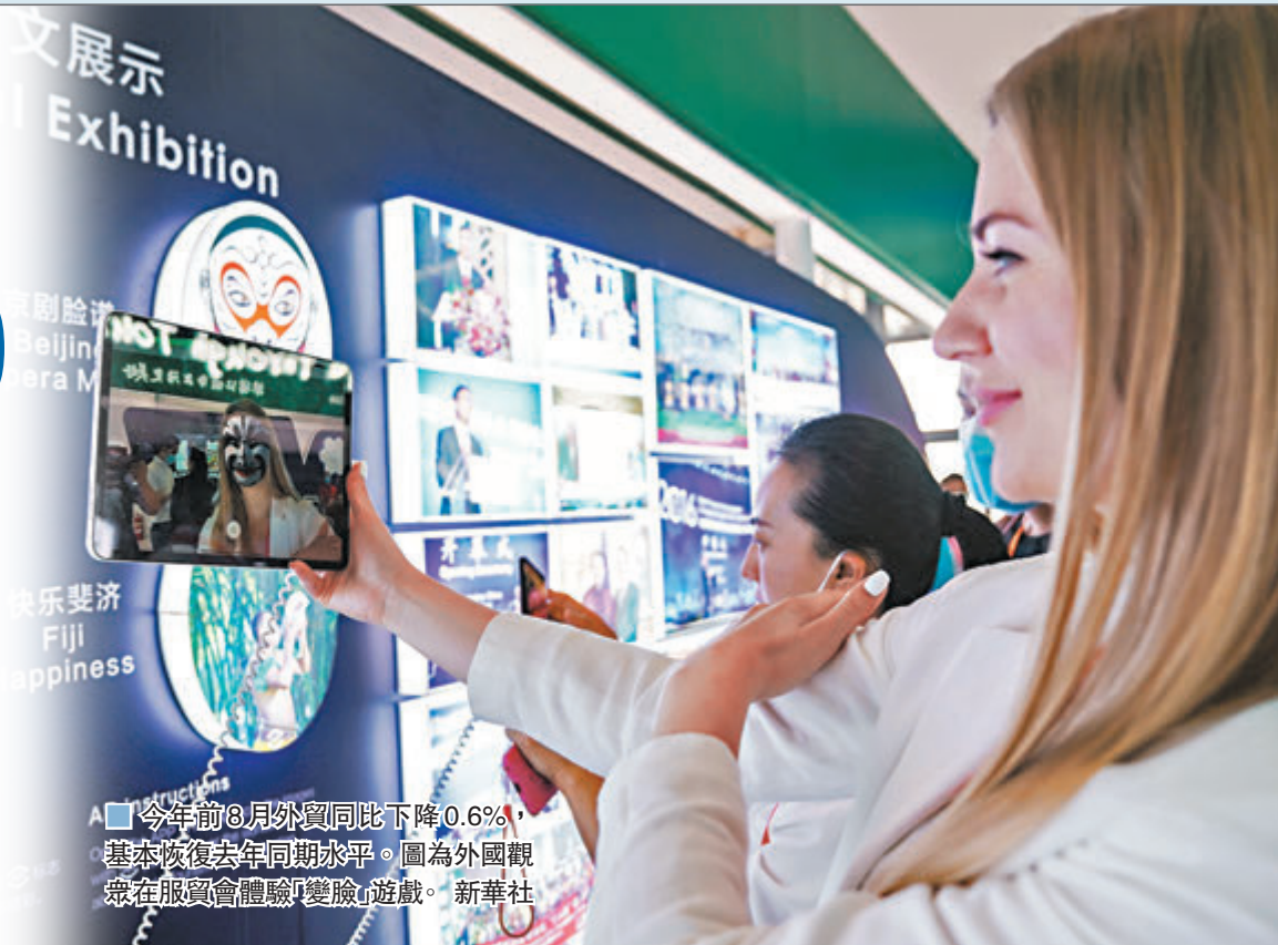
■今年前8月外貿同比下降0.6%，基本恢復去年同期水平。圖為外國觀眾在服貿會體驗「變臉」遊戲。

香港文匯報訊（記者 海巖 北京報道）受益於全球經濟從疫情中逐漸復甦帶動外需回暖，以及防疫物資出口高速增長，8月中國出口繼續超預期增長，以人民幣計同比增長11.6%，創去年3月以來新高。在連續兩個月10%以上高速增長帶動下，今年前8個月出口同比增長0.8%，為年內首次恢復增長。