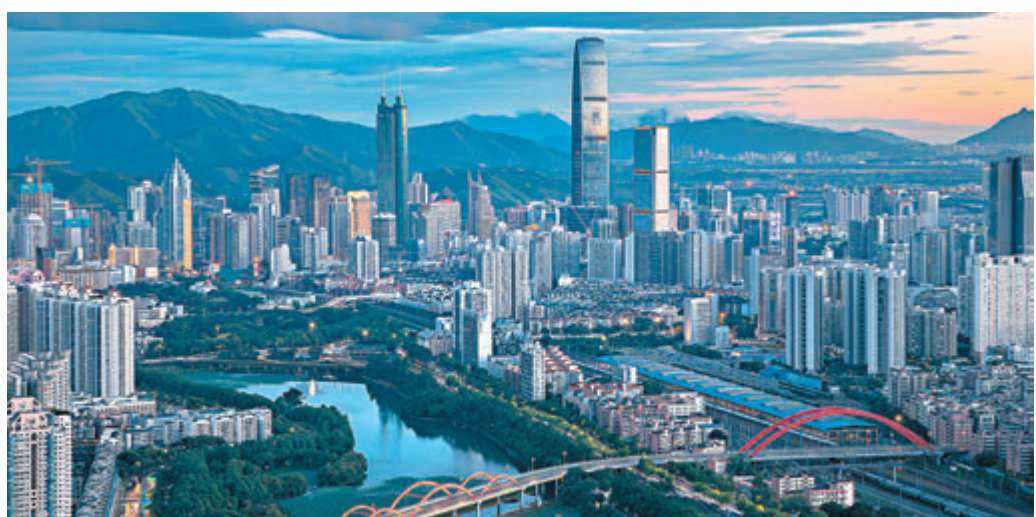
■深圳人均GDP 2025年料可達3.5萬美元。圖為深圳羅湖。

報告認為，深圳未來40年將是消費紅利和科技紅利進一步凸顯的40年。深圳作為中國內地一線城市中對外貿易依存度最高的城市，未來將從「出口-創收-消費」的增長循環向「消費-培育創新-培育新企業-創造新產品-對外輸出」轉型。