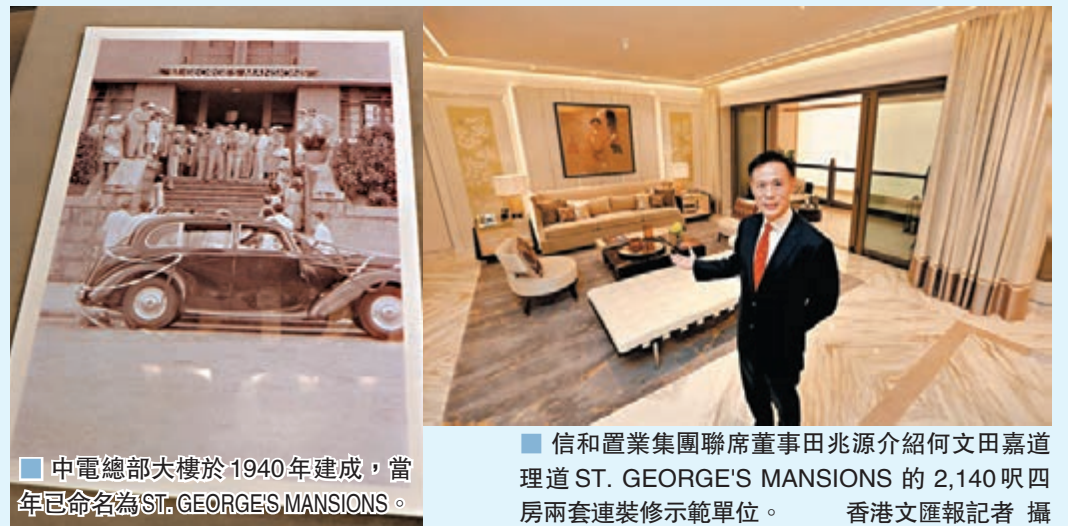
中電總部大樓於1940年建成，當年已命名為ST. GEORGE'S MANSIONS。

展望本港樓市前景，他認為，近期市場上新盤推售數量不算多，惟整體銷情不錯，部分新盤更是每一輪都沽清，反映市場需求及積聚的購買力相當大，相信本港整體樓價會平穩發展。另外，由於本港豪宅供應少，資金持續流入香港，低息環境持續，近期股票市場上升引發的財富效應，都令近月來逾億元豪宅頻錄成交，相對而言，中關關係緊張對樓市的影響已不大，料豪宅市道及樓價會持續向好。