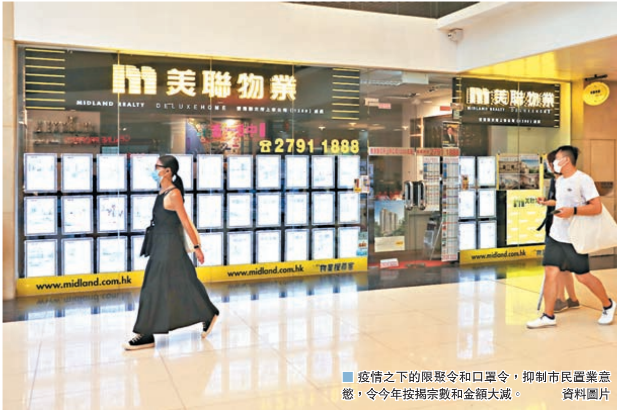
疫情之下的限聚令和口罩令，抑制市民置業意慾，令今年按揭宗數和金額大減。資料圖片

該行指，今年首8個月現樓按揭宗數為52,515宗，比去年同期的68,060宗減少15,545宗或22.8%；料全年現樓按揭宗數只得79,000宗，按年回落幅度將達兩成，跌破八萬宗水平外，並將創4年新低。