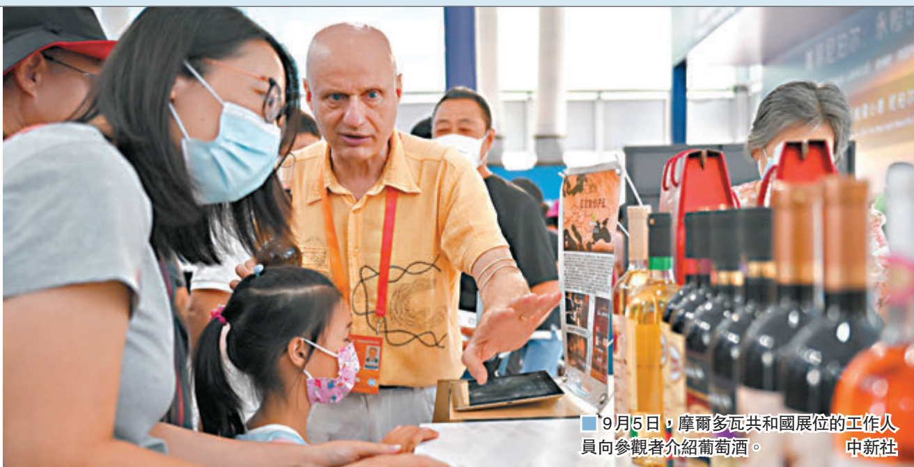
9月5日，摩爾多瓦共和國展位的工作人員向參觀者介紹葡萄酒。

香港文匯報訊（記者 朱燁 北京報道）以「新金融、新開放、新發展」為主題的2020中國國際金融年度論壇，昨日亮相2020中國國際服務貿易交易會（下稱服貿會），「一行兩會」領導出席並向國際傳達了中國金融業持續擴大開放的積極信號。中國人民銀行副行長陳雨露表示，截至7月末境外機構和個人持有境內的人民幣金融資產餘額已經增長到7.74萬億元（人民幣，下同），同比增長37%，未來人民幣能承擔更大的國際責任。