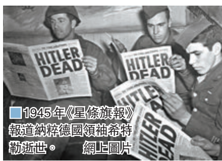
1945年《星條旗報》報道納粹德國領袖希特勒逝世。網上圖片

《星條旗報》由國防部資助，但堅持獨立採編，主要向派駐海外的美軍提供最新消息。國防部曾表示，防長埃斯珀是審核部門預算後決定停辦，不過15名共和、民主兩黨參議員去信埃斯珀，強調《星條旗報》是新聞自由的重要組成部分，表明參議院將不會通過削減相關撥款的預算案。 ■美聯社/路透社