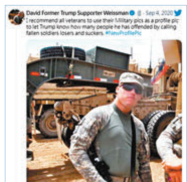
韋斯曼在twitter發起換頭像照運動。

退休少將伊頓在twitter向特朗普表示，自己的父親在越戰中執行空中支援任務時陣亡，稱「倘若美軍中有人認為你(特朗普)不是失敗者或笨蛋，我會感到驚訝，你不是愛國者」，並呼籲其他人在11月大選投票，將特朗普趕出白宮。曾在伊拉克和阿富汗服役的眾議員克羅形容，特朗普貶低軍人的言論是「可恥之極」，稱國民參軍是出於無私，並非為了報酬或獎章，「這是特朗普永遠不會明白的事」。自由派退伍軍人組織「VoteVets」指出，特朗普不應如此殘酷地攻擊退伍軍人，稱退伍和現役軍人應在大選中，票投前副總統拜登。 ■綜合報道