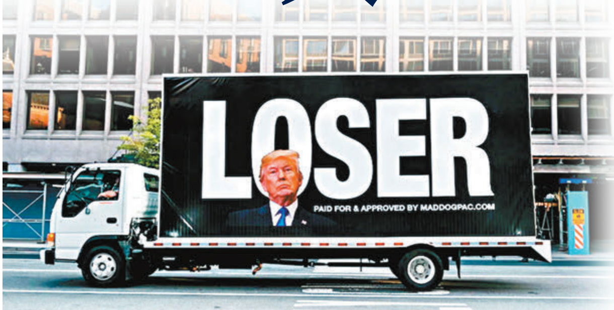
華盛頓有貨車寫上「失敗者」諷刺特朗普。網上圖片