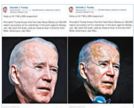
拜登真樣與「老化」樣貌(右)對比。 ■綜合報道

陣營只是從來源片段抽取其中這一句，而拜登當時是說，「特朗普和彭斯提出一個我感興趣的說法，稱『你不會在拜登治下的美國變得安全』，但他們的證據在哪？暴力正是在特朗普治下的美國發生。」拜登競選團隊回應指，特朗普陣營無法根據事實作出辯解，故只能發布修改的影片誤導選民。 ■綜合報道