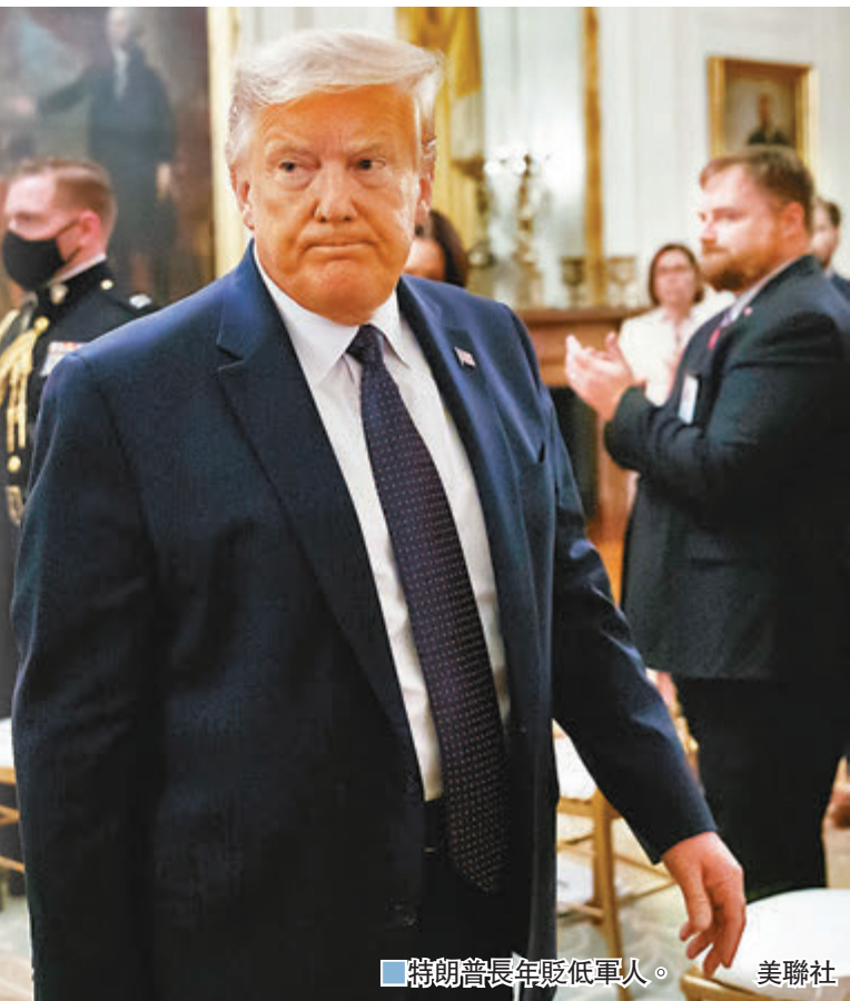
特朗普長年貶低軍人。