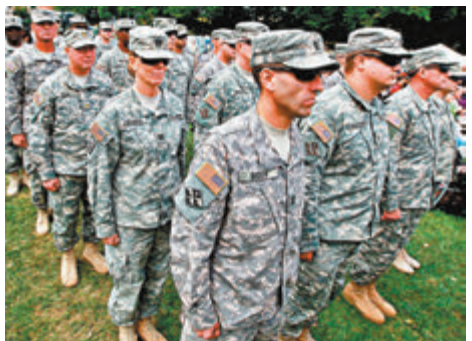
拜登提到已故長子博·拜登(中)自願參軍，強調兒子不是失敗者。

特朗普經常標榜自己支持軍人，軍方亦被視作共和黨票倉，不過《軍事時報》上周的民調顯示，特朗普在現役軍人中的支持率只有37%，不敵拜登的41%支持率，無疑為特朗普的選情敲響警鐘。 ■綜合報道