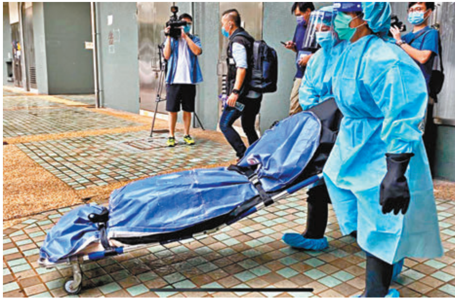
作工在葵涌邨謀殺案現場抬走21歲青年的遺體。

社會福利署發言人表示，涉事家庭並不是社署的跟進個案。社署社工已接觸有關家庭，就家庭的福利需要提供情緒支援及兒童福利等支援及協助。東華三院回覆傳媒稱，得知一名畢業學生在家中離世，東華三院及學校都極為難過和悲痛。