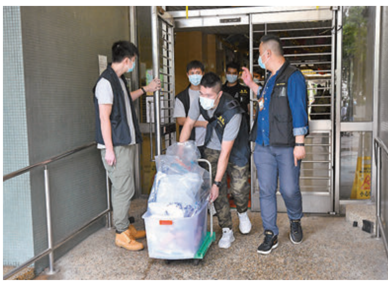
重案組探員離開映葵樓。

社會福利署發言人表示，涉事家庭並不是社署的跟進個案。社署社工已接觸有關家庭，就家庭的福利需要提供情緒支援及兒童福利等支援及協助。東華三院回覆傳媒稱，得知一名畢業學生在家中離世，東華三院及學校都極為難過和悲痛。