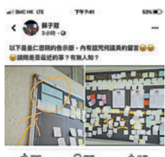
皇仁書院被曝告示板出事。

香港文匯報記者就事件向教育局查詢，發言人回覆指已收到有關投訴，正與學校了解事件，並已要求學校提交報告。據悉，皇仁校方得悉事件後已即時將相關標貼移除，並按既定機制進行調查及跟進。教育局重申，學校是學生學習的地方，任何人士不應利用學校作為表達政治訴求或散播仇恨訊息的地方。