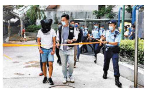
涉嫌襲女童的私家偵探，日前被押返慈雲山重組案情。

香港文匯報訊(記者 葛婷)一名私家偵探涉嫌由今年5月起，在黃大仙及葵青區向4名女童搭訕，藉詞拍攝或帶女童到大廈梯間，進而向女童摸胸及拍片。男子被控向16歲以下的兒童作出猥褻行為、製作兒童色情物品及三項非禮罪，昨在九龍城裁判法院提訊，控方預期會有新增控罪。裁判官梁少玲將案押後至9月10日在西九龍法院再訊，以便讓其中一名受害人進行緊急認人手續。裁判官拒絕被告擔保，還押警方看管。