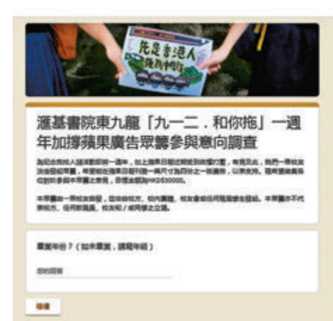
「黃校友」借學校名義眾籌，為《蘋果》賣廣告。網上截圖

教聯會主席黃錦良在接受香港文匯報訪問時表示，過去已有不少人利用學校、校友群組或學校關注組等名義騎劫學校立場，以支持自身的政治目的，而「打着學校的旗號」更能獲得學校的持份者，即家長、學生、校友的信任，此類行為為可能涉及欺詐。