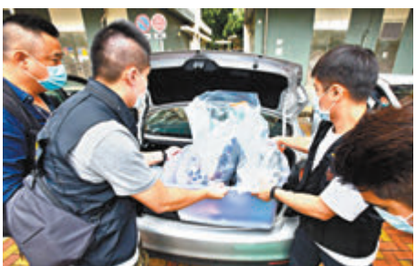
重案組探員在葵涌邨倫常命案現場帶走一批證物。

昨日凌晨3時許，母親負傷往鄰房向丈夫表示殺了麟仔，丈夫聞訊趕往查看發現麟仔已經昏迷不醒，大驚叫醒幼子報警；