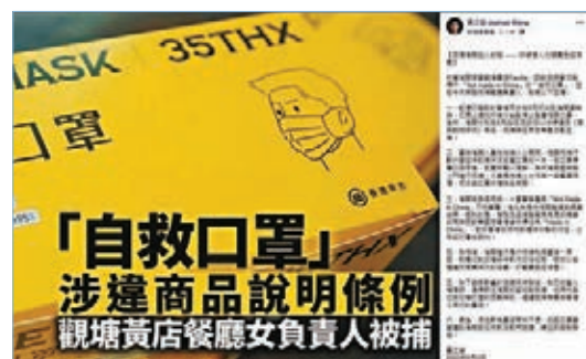
黃之鋒在fb回應事件。黃之鋒fb截圖。明，聲稱對事件感到「難以理解」，又抹黑海關行動是「執行政治任務，打擊『黃色經濟圈』」，他會聯絡律師支援被捕者。 香港文匯報記者 蕭景源

於該商戶一直未能提供認證，證明相關口罩符合所作的標示聲稱，海關於5月先後拘捕該商戶涉嫌違反《商品說明條例》的一名代表及一名董事。 海關急尋東主下落 在跟進調查後，海關發現觀塘一間餐廳有擺賣相關口罩，包裝盒印有「香港眾志」字樣，並印有「NOT MADE IN CHINA」、「ASTM Level 1」、「BFE 95%」、「Fluid Resistance」及「PFE 95%」等標示，與香港眾志在網上售賣的口罩包裝一模一樣。昨以涉嫌違反《商品說明條例》拘捕31歲涉案女負責人，但東主則不在場，海關正尋找其下落。 據悉，涉案的店舖為「黃店」The ARTlab by favilla。前「香港眾志」秘書長黃之鋒其後發表聲