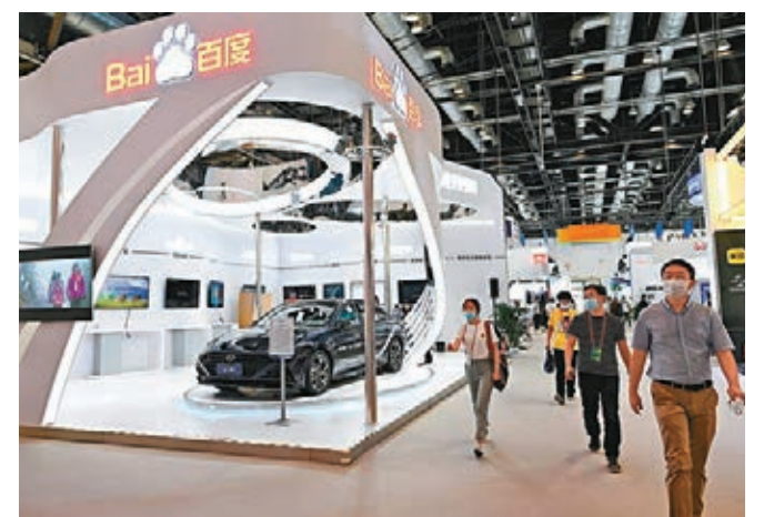
■ 2020服貿會展區。