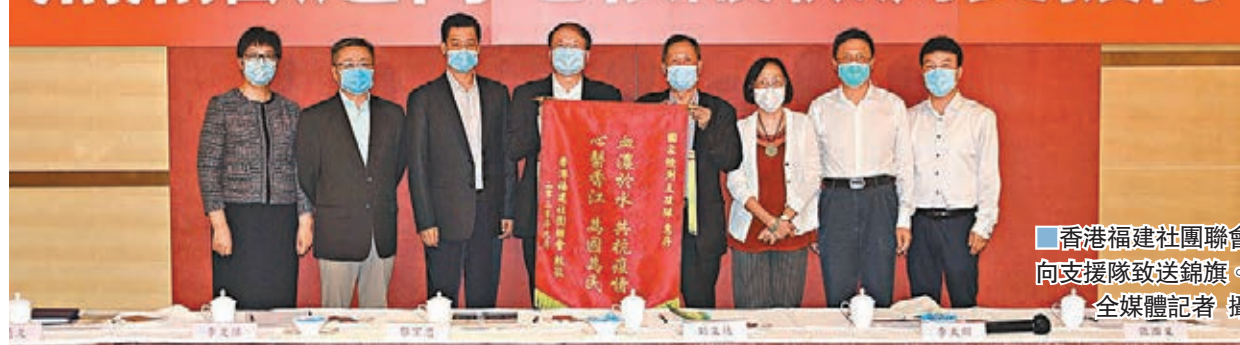
香港福建社團聯會向支援隊致送錦旗。