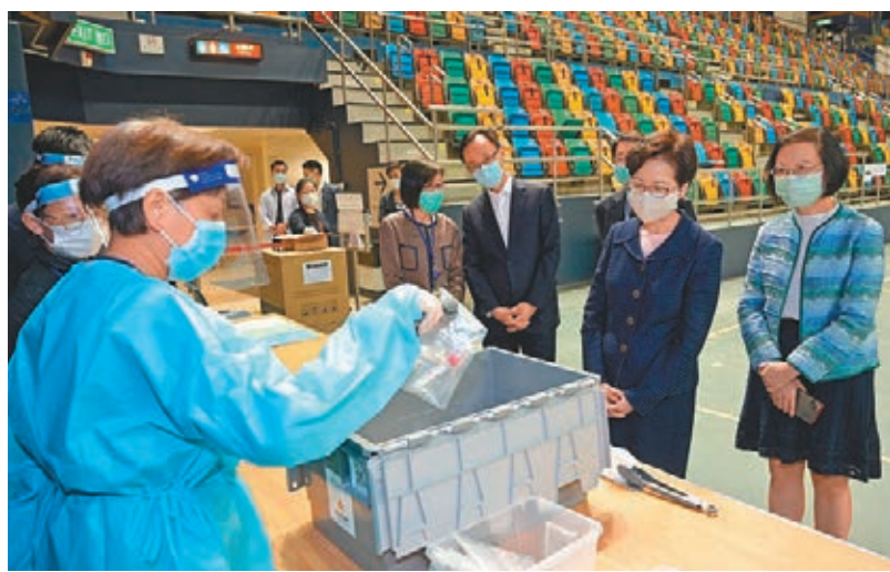
林鄭月娥聽取伊利沙伯體育館社區檢測中心的醫護人員介紹檢測流程。

勞工及福利局局長羅致光則走訪天水圍體育館社區檢測中心，了解運作情況和為工作人員打氣。他強調，及早找出隱形患者對防疫工作十分重要，達至「早識別、早隔離、早治療」，切斷社區的傳播鏈。從初步普及社區檢測計劃結果來看，專家們都認為有超過百名隱形患者在社區中，有可能散播病毒，而可能大部分隱形患者都不會知道自己帶有病毒，所以呼籲大家，為己為人為香港，參與檢測。