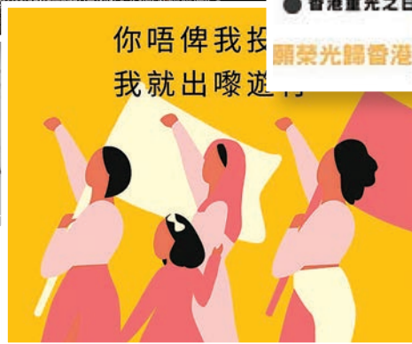
較「溫和」海報針對「和理非」作宣傳。