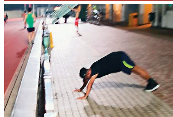
（上圖）本月2日，「特訓班」在屯門鄧肇堅運動場進行特訓，為明日搞事作「戰前」準備。（下圖）疑似「特訓班」成員練掌上壓。