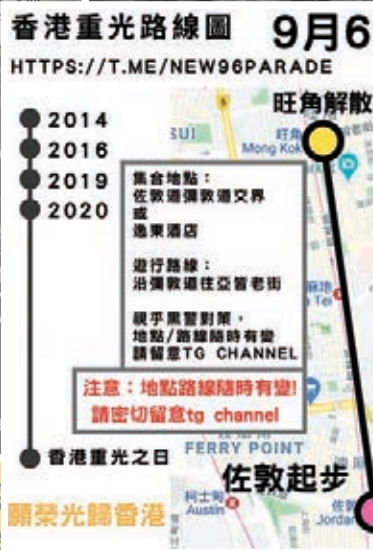
黑暴發布非法集結路線圖。