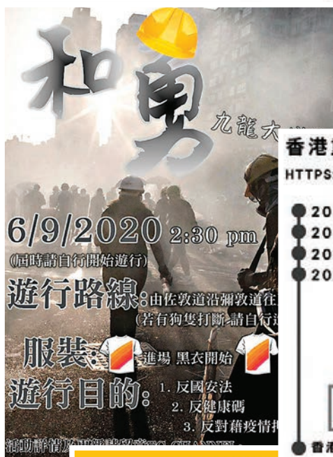
遊行搞手藉社會議題炒作，催谷人數。