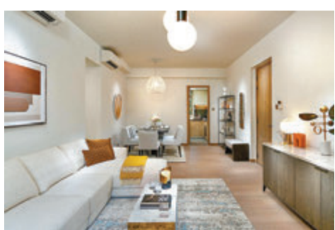
海日灣II夥拍Indigo Living耗資逾百萬元打造全新示範單位。

另外，億京於大埔白石角的海日灣II截至昨日下午2時30分，已累計售出803個單位，累計套現金額逾65.4億元，現正銷售的伙數290個單位，價單單位以先到先得形式