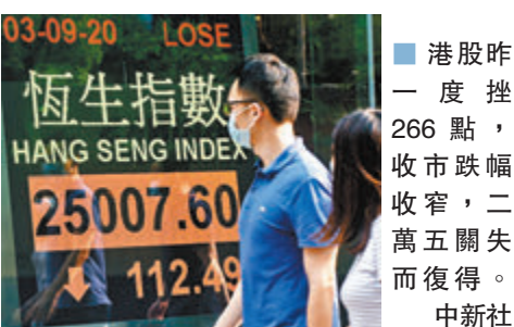
港股昨一度挫266點，收市跌幅收窄，二萬五關失而復得。中新社

有內地分析師指出，在互聯網領域裏，虛擬商品及服務行業一直屬於較隱形行業，因而被大多數股民所忽略，但該行業的市場規模，其實早已突破萬億元級別。中國虛擬商品及服務行業由2014年的6,456億元，增至2018年的11,905億元，按年的複合增長率為16.5%，並預期於2024年增至22,452億元。而未來5年，成長速度最快的領域，正是文娛和遊戲兩個業務，所以福祿網絡正是當中的受惠股。