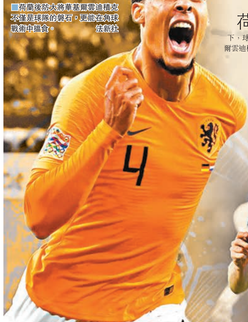
荷蘭後防大將華基爾雲迪積克不僅是球隊的磐石，更能在角球戰術中搵食。