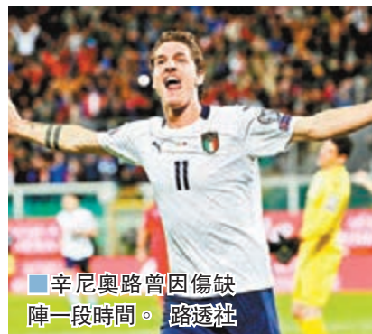
辛尼奧路曾因傷缺陣一段時間。