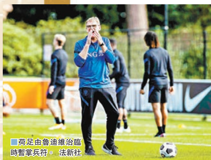
荷足由魯迪維治臨時暫掌兵符。

文仙尼今次的大軍名單充滿驚喜，有年僅21歲的國際米蘭新晉中堅巴斯東尼，亦有效力薩索羅的33歲前鋒卡佩圖，另外效力中超上海申花的艾沙拉維亦告入選。雖然球隊目前創下11連勝紀錄，但文仙尼似乎未對延續紀錄太過在意，今次名單的試陣意圖十分明顯。球隊另一焦點落在年初曾嚴重受傷的羅馬新星辛尼奧路身上，這位被喻為「新托迪」的中前場天才球員在意甲復賽後表演不俗，文仙尼亦希望打造他為新一代進攻核心，且看他在今場歐國聯主場對波斯尼亞一戰能否有精彩演出？（有線601及661台、香港開電視77台周六2:45a.m.直播）