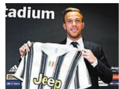
艾法美路展開職業生涯新一頁。