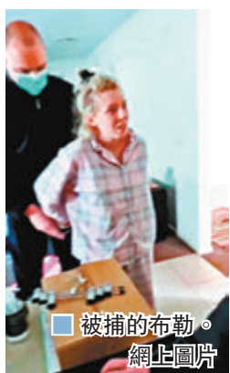
被捕的布勒。

澳洲維多利亞省因疫情嚴峻，實施嚴格防疫措施，當地一名懷孕兩月的孕婦因為不滿措施，於是在社交平台號召網民示威，警方接報後竟然以涉嫌煽動罪，上門在兩個子女面前將她拘捕。