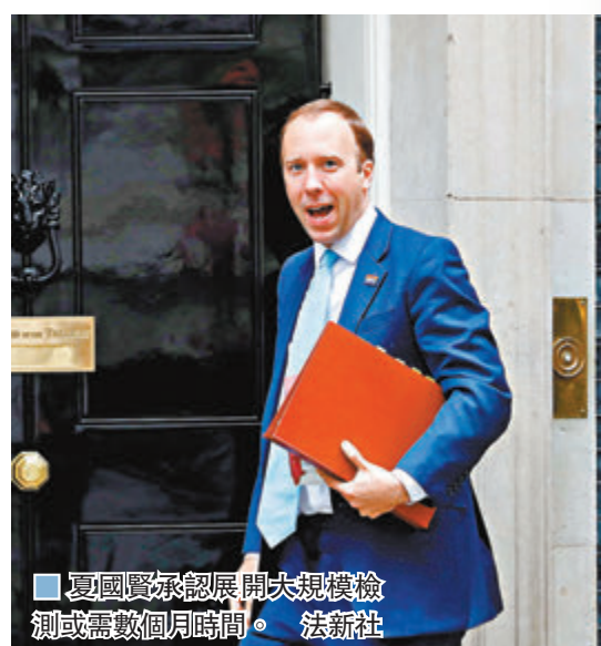
夏國賢承認展開大規模檢測或需數個月時間。法新社

英國政府昨日公布，計劃斥資5億英鎊(約51億港元)試用新冠快速測試工具，同時推動全民檢測計劃，包括推出20分鐘可產生結果的快速測試，目標是在今年秋季令全民檢測成為常態，助民眾重返正常生活。當局已選址部分地區及學校，安排醫生及師生率先每周進行病毒檢測，實驗全民檢測的成效。