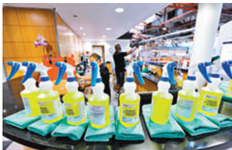
美國有商戶準備大批消毒用品清潔物品。

美國政府正全力研發新冠疫苗，據悉衛生部門已去信各州政府，要求準備好在11月1日之前、亦即總統大選前2日，準備好分發新冠疫苗，包括在有需要的時候，為分發疫苗的機構或設施提供豁免或放寬限制，預計必要行業工人及長者等高危群體，將可優先免費取得疫苗。