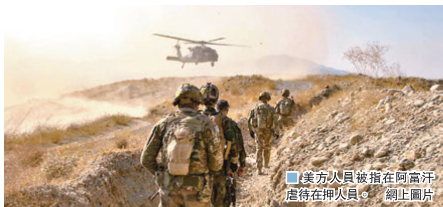
美方人員被指在阿富汗虐待在押人員。

美國政府前日以國際刑事法院繼續調查美方人員為由，宣布對法院兩名高級官員實施制裁。美方的舉動引起國際嘩然，國際刑事法院大會主席權五坤表明堅決反對美方制裁，聯合國秘書長古特雷斯對此表示密切關注，歐盟亦表示會從一切試圖損害法院地位的措施中，保護法院。