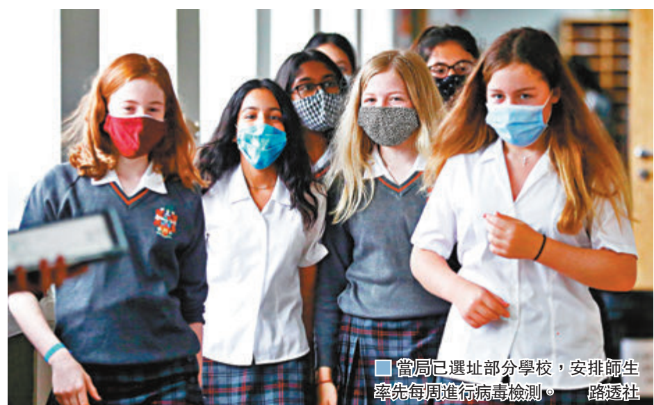
當局已選址部分學校，安排師生率先每周進行病毒檢測。