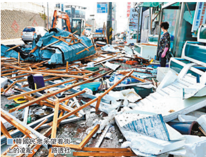
韓國民眾呆望着街上的凌亂。