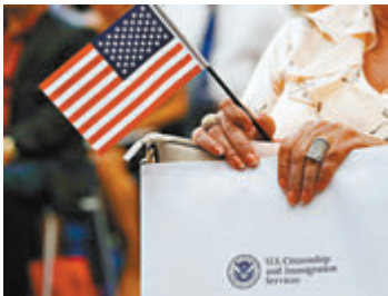
民權及移民組織等對新措施表示憂慮。