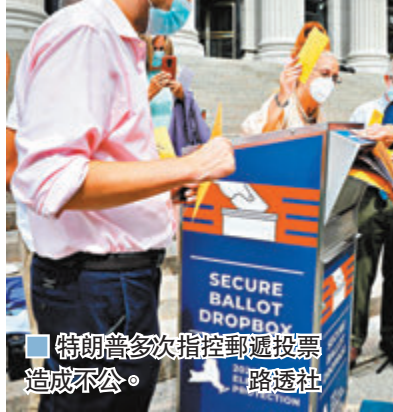
特朗普多次指控郵遞投票造成不公。