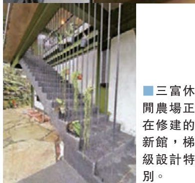
三富休閒農場正在修建的新館，梯級設計特別