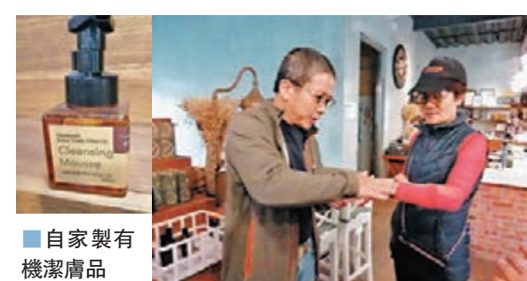
自家製有機潔膚品