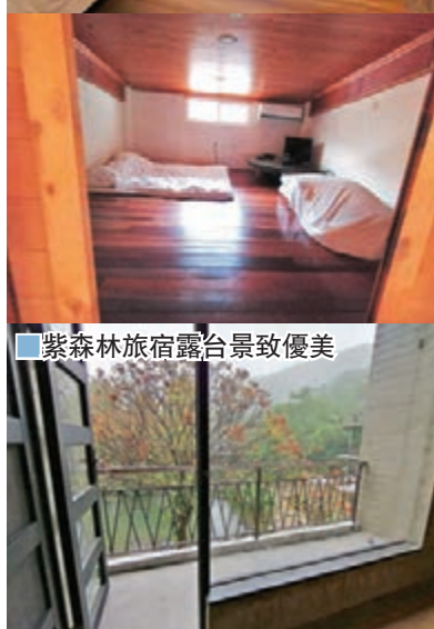
紫森林旅宿露台景致優美