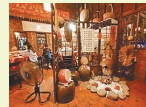
地瓜生態故事館導覽