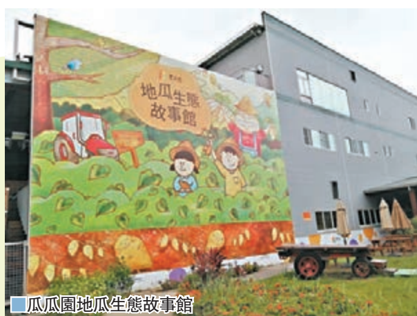
瓜瓜園地瓜生態故事館