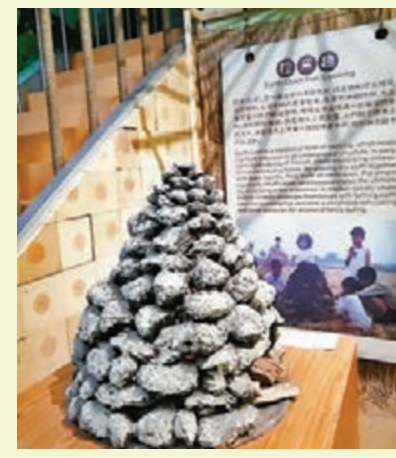
地瓜生態故事館導覽知識