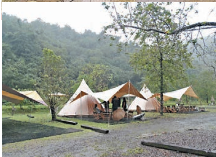
東風有機農場提供露營住宿的地方