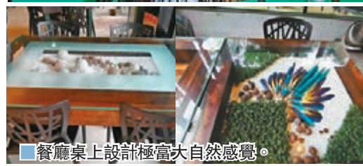
餐廳桌上設計極富大自然感覺