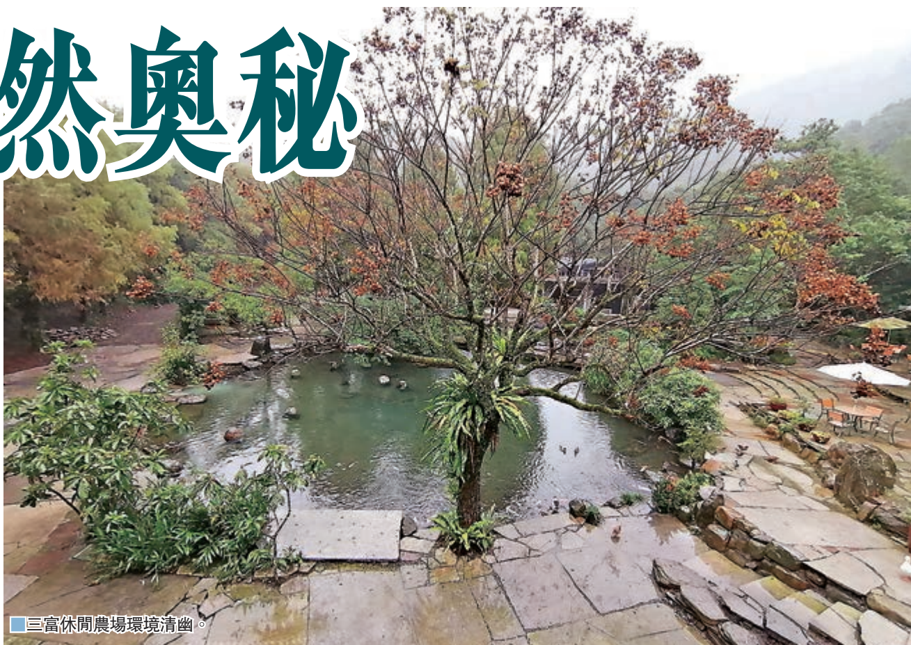
三富休閒農場環境清幽