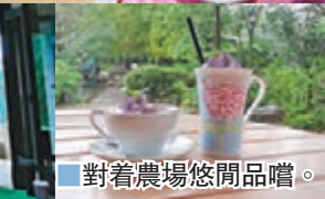
對着農場悠閒品嚐