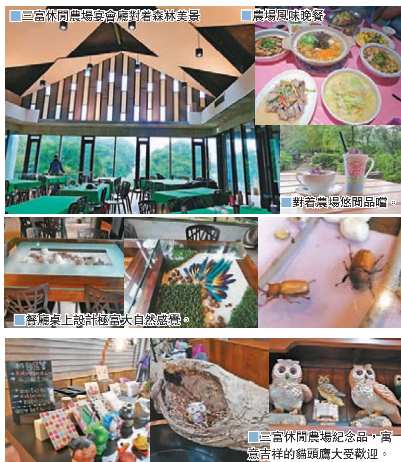
三富休閒農場宴會廳對着森林美景