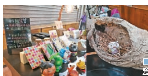
三富休閒農場紀念品，寓意吉祥的貓頭鷹大受歡迎