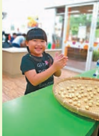
瓜瓜園的小公主示範搓地瓜圓