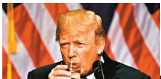
早於2017年已有網民發現特朗普喝水時需使用雙手，且動作有點生硬。