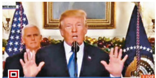
特朗普去年11月就以以色列議題發表演說時，多次吐字不清。

美國總統特朗普去年11月曾在沒有事先安排下突然入院，當時白宮解釋為健康檢查，不過一名資深記者近日出版新書揭露，副總統彭斯在特朗普入院時，一度接獲指示需準備就緒，隨時代理總統職務，引發外界揣測當時特朗普或曾「小中風」。特朗普反駁相關消息為「假新聞」，駐白宮醫生康利亦應特朗普要求發表聲明，強調特朗普從未中風。