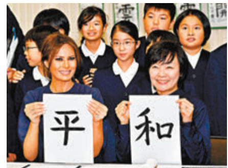
梅拉妮亞使用私人電郵商談公務，包括出訪日本的行程安排。