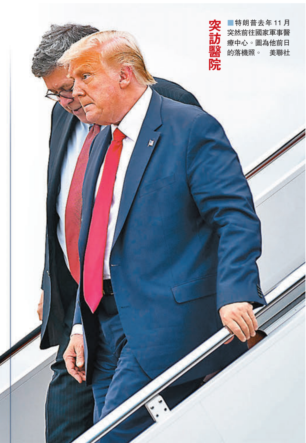
特朗普去年11月突然前往國家軍事醫療中心。圖為他前日的落機照。