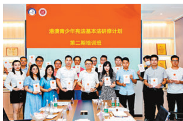
20多名在深香港青年代表實地走訪考察企業。