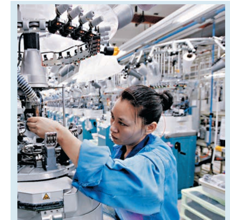
■上月財新中國製造業PMI高於預期, 分項指標顯示, 製造業生產指數、新出口訂單指數再次刷新2011年2月以來的新高, 生產和需求同步強勁恢復。

這預示着在中國領先擺脫疫情、加快復工復產帶來的出口替代效應, 以及防疫物資和高技術品等出口大增的支撐下, 伴隨着海外需求逐漸修復帶動非防疫物資需求增加, 8月份出口