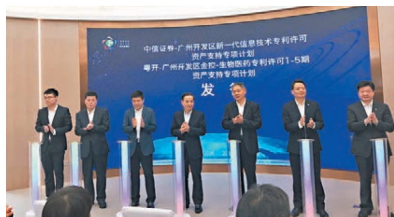
■廣州開發區兩隻知識產權證券化產品獲批准發行。