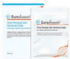
童顏新肌重塑面膜

「亞洲面膜專家」Eurobeaute 再創面膜護膚奇跡，首度引進抗氧成分艾地苯，令家用面膜護膚享受。今年品牌延續橙色童顏奇跡，在逆齡產品「童顏新肌重塑療程」系列發布新世紀抗老逆齡面膜——「童顏新肌重塑面膜」，採用艾地苯，配合 17 種氨基酸與透明質酸等修護保濕成分，一次實現肌膚——抗老、去紋、修復、亮白、保濕、抗敏「6 大童顏奇跡」。「童顏新肌重塑面膜」的加盟，令「童顏新肌重塑療程」系列，發揮抗老功效，成就雙倍童顏嫩肌。