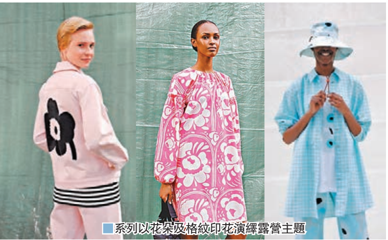
系列以花朵及格紋印花演繹露營主題

系列更推出了兩款耳目一新的設計，分別是於背面印上品牌經典 Unikko 印花的寬鬆淡粉紅牛仔套裝及每位野外探險者必備的功能性套頭外套，帶來更多元化的時尚單品，讓你隨心演繹真我個性。