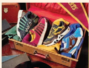
Court Pro II CMF 鞋款

魔法世界中最令人狂熱的就是魁地奇球賽，每當電影中出現比賽的情節，都會令人不禁為哈利及隊友們緊張萬分！品牌以霍格華茲魁地奇球賽中各學院的隊袍為設計理念，在品牌四大經典鞋款上加入各學院的徽章及代表顏色設計，變奏出四款魁地奇球隊的專屬隊鞋，並於鞋身印上各學院的代表動物，可說是將各學院的特色都集合在一起。系列同時備有男女裝尺碼可供選擇，趕快穿上它，成為學院一分子，為所屬學院打打氣！