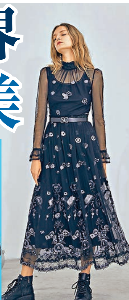
SHIATZY CHEN 早秋系列