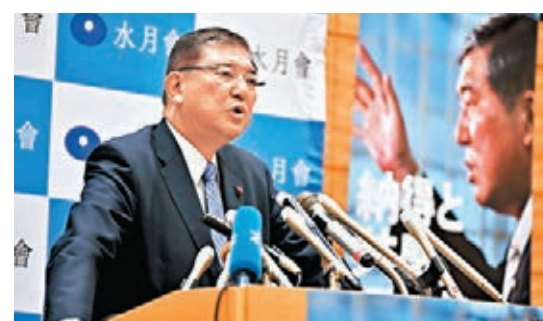
石破茂第4次參選黨魁。