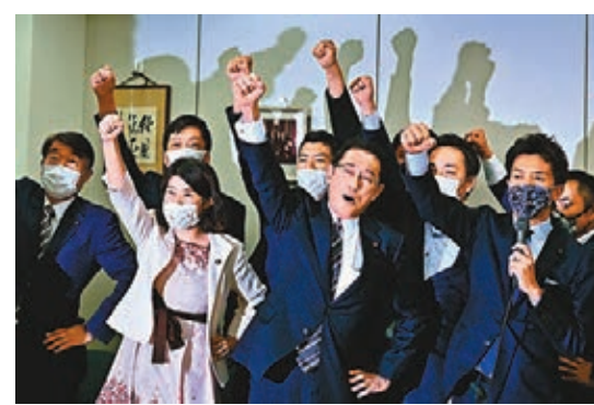
岸田文雄(中)宣布參選，與派系成員現身造勢。