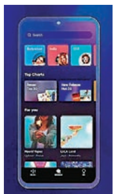
Resso在3月登陸印度及印尼。

影音分享平台 TikTok 在美國被封殺，不過其母公司字節跳動持續在全球拓展業務，旗下音樂串流平台 Resso 在3月登陸印度及印尼後，已錄得多達1,520萬次下載，發展速度媲美另一音樂串流平台 Spotify。