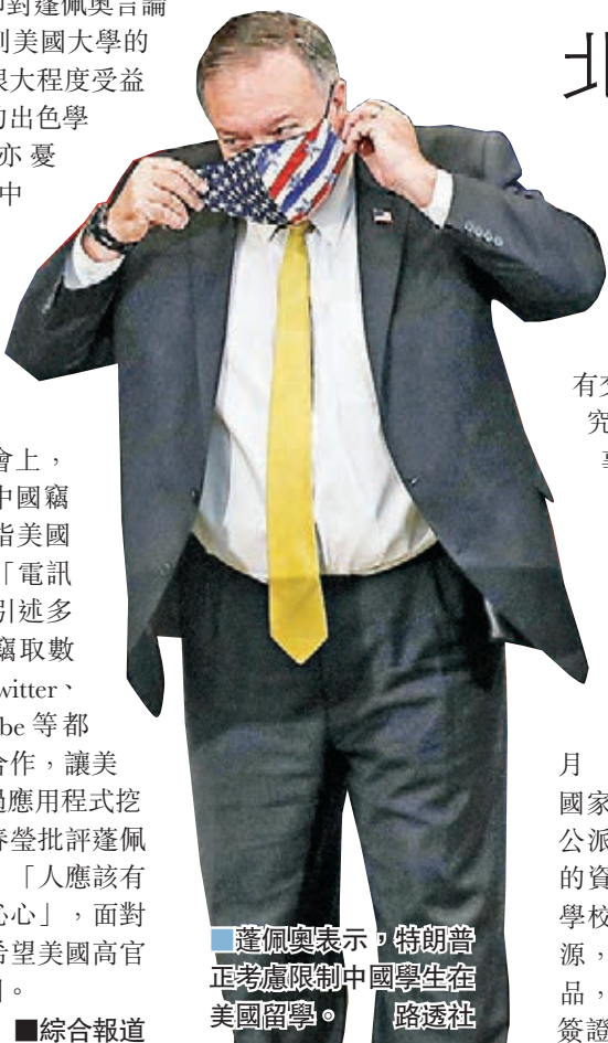
蓬佩奧表示，特朗普正考慮限制中國學生在美國留學。

中國外交部發言人華春瑩昨日在例行記者會上，回應蓬佩奧有關中國竊取數據的言論，指美國一直是全球頭號「電訊洩密大戶」，並引述多個媒體披露美國竊取數據的事例，包括 twitter、facebook、YouTube 等都被迫與美國政府合作，讓美國國家安全局通過應用程式挖掘數據情報。華春瑩批評蓬佩奧每天都在說謊，「人應該有起碼的誠信和廉恥心」，面對鐵一般的事實，希望美國高官立即停止抹黑中國。