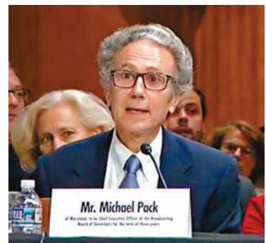
帕克被批評言論不當。資料圖片