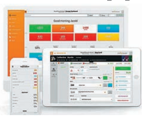
StayNTouch 在全球獲550間酒店使用。

命令，性質與封殺影音分享平台 TikTok 的行政命令類似，指出程式由中國公司持有，對美國國家安全構成威脅，下令石基在120日內出售 StayNTouch。《華爾街日報》引述知情人士報道，MCR 已同意出價4,600萬美元(約3.6億港元)收購 StayNTouch，是 MCR 歷來首次投資科企，據悉會在本月30日前完成交易。MCR 是來自紐約的私人公司，旗下管理逾