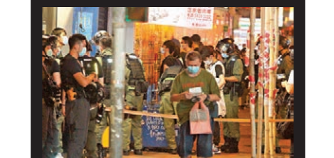
■圖為今年8月31日晚,大批違「限聚令」者等候查核身份。