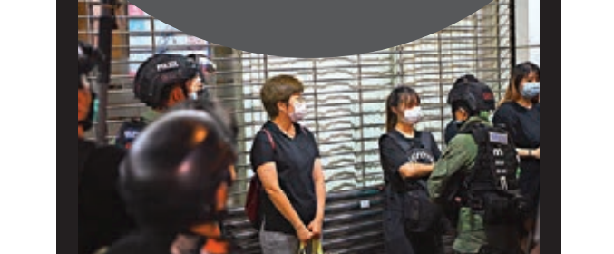
■8月31日晚上,旺角、太子有不少年輕人借故參與非法集結。