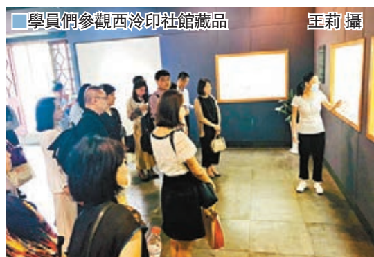
學員們參觀西泠印社館藏品