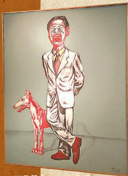
曾梵志1994年作品《面具系列11號》。