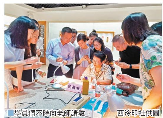
學員們不時向老師請教。

三年來，香港「西泠學堂」吸引力眾多藝術愛好者參加。今年上半年在新冠肺炎疫情的影響下，香港「西泠學堂」還將線下課程移到線上，與新老學員在「雲端」相聚，在師生之間的互動實踐中實現了「停課不停