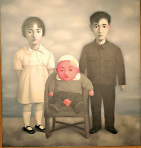
張曉剛1998年作品《血緣—大家庭：全家福》。