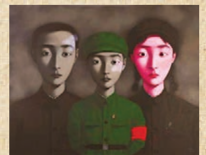
張曉剛創作於1995年的作品《血緣：大家庭3號》。

「這是一個爆炸性、亦是非常複雜的系列作品。」張頌仁認為當時西方思想製造了一種形式，比如是消費主義，為人們帶來新的認識，同時也開始尋找新的身份與方向，因此作品呈現了一個社會轉變之間迷茫的感覺。「穿着西服的人物都有新時代的象徵，無論個人是否同意，這些都是歷史參照的一部分。」張頌仁認為《面具系列11號》都突顯了人們當時對於精神與未來的一種追求、文化性的嚮往，更重要是體現了當時的人展開了對世界的認識。