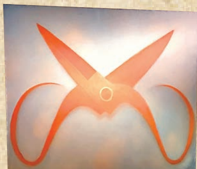
毛旭輝2000年作品《土紅色剪刀》。