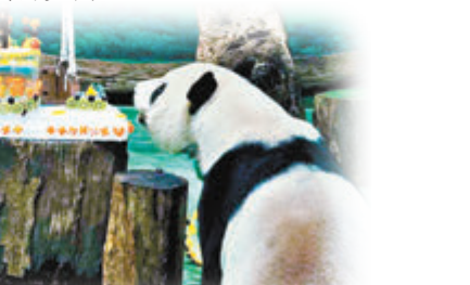
大熊猫「團圓」和「圓寶」歡慶16歲生日。

象徵經過多年努力誕生大熊猫寶，也希望在疫情下，大家的生命能過得好。團方介紹，「團圓」今日63日齡，體重3.8公斤，健康發育中，今年底可與外界見面。