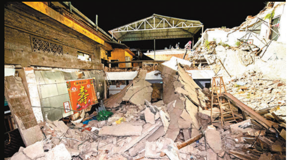
8月29日，山西省臨汾市，襄汾縣陶寺鄉陳莊村聚仙飯店坍塌事故現場一片狼藉。

安全專項檢查要對非法違法建築一律予以關停，對人員聚集場所存在建築安全、消防安全隱患的，責成產權人或使用者採取措施予以加固或改進，不能保證安全的不能進行營業。