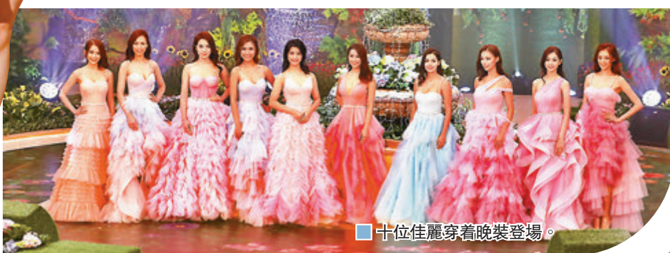
十位佳麗穿着晚裝登場。