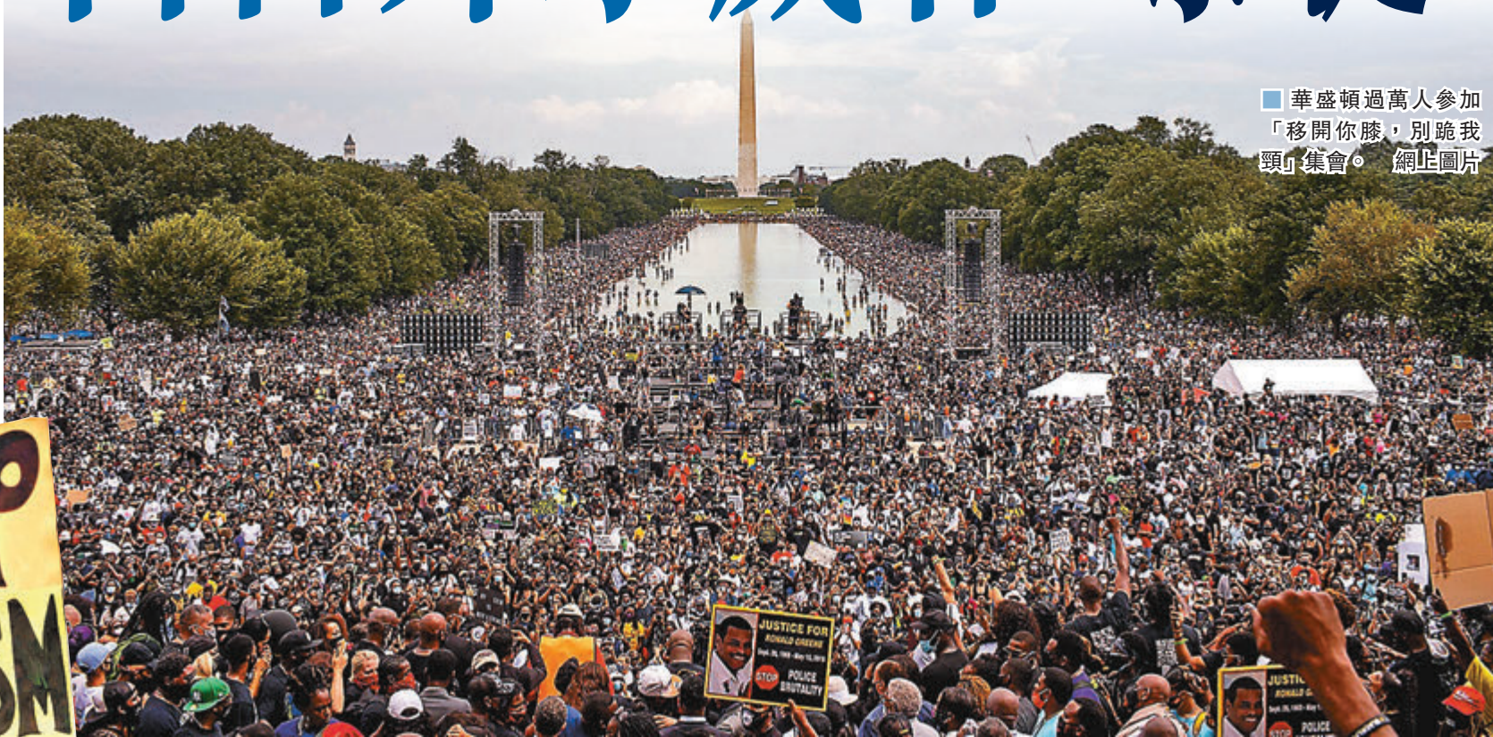
華盛頓過萬人參加「移開你膝，別跪我頸」集會。■網上圖片