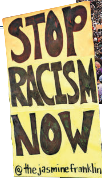
有示威者要求停止種族主義。