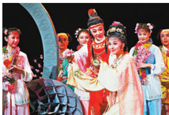
■首場演出的黃梅戲《紅樓夢》。

此次演出活動邀請了抗擊疫情和防汛救災期間湧現出的先進醫療衛生工作者、人民子弟兵、基層工作者