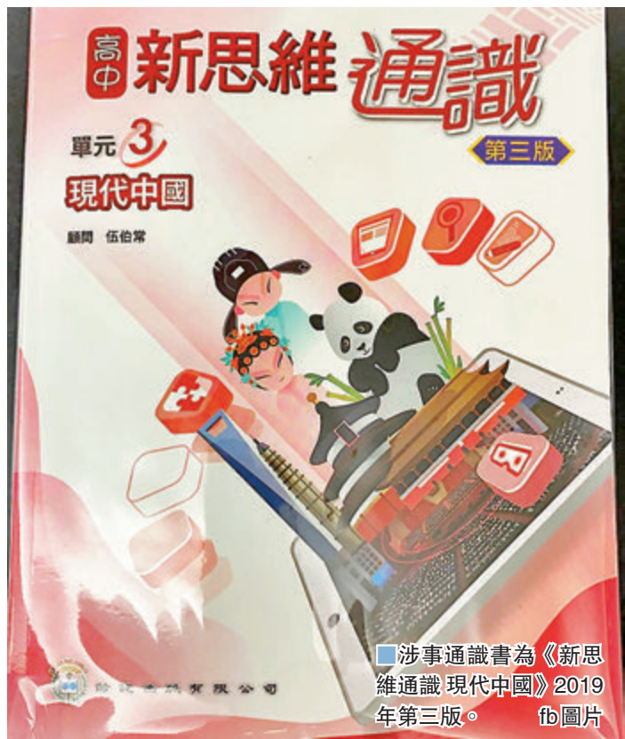
涉事通識書為《新思維通識現代中國》2019年第三版。fb圖片

涉事通識書為《新思維通識現代中國》2019年第三版。有家長在網上群組指，該書獲東九龍某中學選用，當中出現多處問題內容，選材角度偏頗，「八成的取材報章都是來自外國對中國的看法，全部漫畫亦是諷刺針對中國」，卻從不以中國的角度去看待同一件事，絕不客觀。