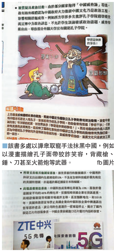
該書又稱中國「科技支出較其他國家落後」，認為中國與其他已發展國家「科技實力有差距」云云。