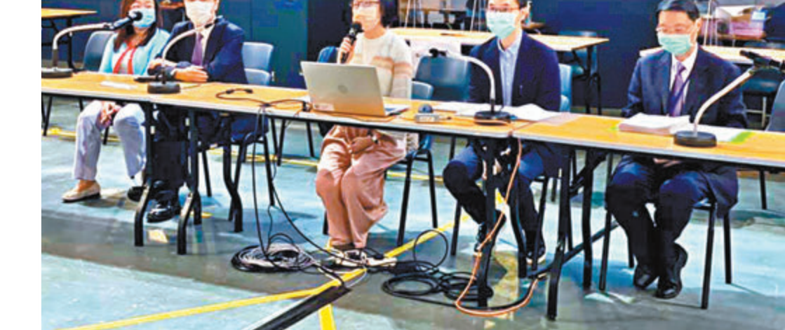
▲在檢測中心擔任小隊長及副組長的醫護人員，昨出席在伊館舉行的簡介會。