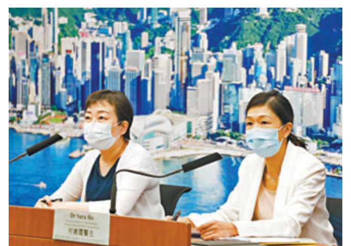
■張竹君(左)認為現難判斷計劃成效，要視乎最終參與人數。

香港文匯報訊(記者 文森)普及社區檢測計劃昨日開放預約即反應熱烈，衛生防護中心傳染病處主任張竹君認為是好開始，但表示現難判斷計劃成效，要視乎最終參與人數。市民昨開始可上網預約檢測後，半日已有近12萬人登記，張竹君昨被問到是否滿意時，表示暫仍難評價，政府沒有訂立目標，成效最終要視乎最終有多少人參與，以及找到多少確診者。她鼓勵市民踴躍參加檢測計劃，特別是目前仍有約三至四成個案源頭不明，說明社區有隱形患者，希望市民趁此機會檢測，以了解自己身體狀況，亦方便政府檢視社區中的隱形患者情況，由相關部門去制定應對計劃。