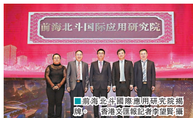
■前海北斗國際應用研究院揭牌。

對前海的發展,姚震邦表示自己的團隊在這裏茁壯成長,目前團隊有10多人,未來很有信心,也希望未來前海還能增加一些政府項目和企業項目對接,在商業配套方面更加完善。