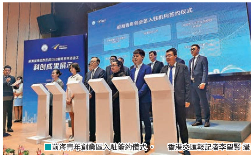
■前海青年創業區入駐簽約儀式。

此外,深港文創基金也同步啟動,該基金是前海科控公司落實《粵港澳大灣區發展規劃綱要》中支持前海「建設國際文化創意基地,探索深港文化創意合作新模式」相關要求,聯合華映資本、青松基金共同發起的深港文創基金,主要布局以文化創意、數字科技應用為核心的創業投資基金,助力文化創意資源聚集,支持前海建設國際文化創意發展新高地。