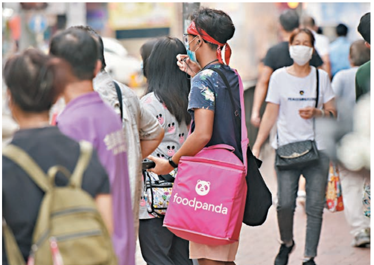
本港新增13宗新冠肺炎確診個案，有foodpanda外賣員確診新冠肺炎。

foodpanda香港昨表示已和確診送遞員聯繫，希望她早日康復，並會全力提供支援協助她度過艱難時刻。foodpanda又表示，在疫情下會繼續建議顧客採用「無接觸送遞」服務，減少感染機會，而外送員送遞期間亦須佩戴口罩，並在每次送餐前後消毒雙手。