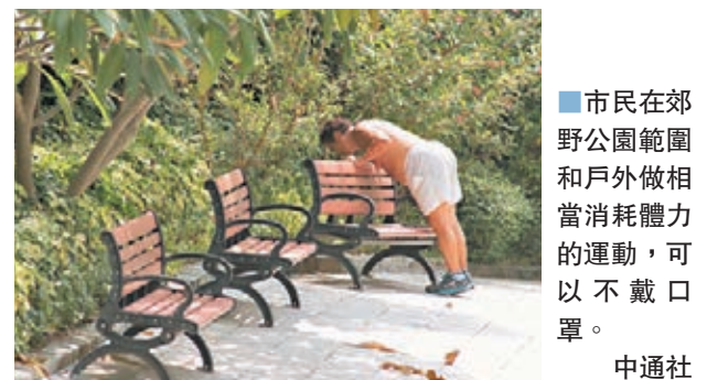
市民在郊野公園範圍和戶外做相當消耗體力的運動，可以不戴口罩。

梁生則表示，過去兩個星期已習慣戴口罩運動，不清楚海濱公園是否屬豁免地點，為安全起見仍戴口罩。他坦言運動時外科口罩也濕透，但為防疫亦沒有辦法，擔心社區有隱形患者，故維持維持零確診一段時間才會放鬆。