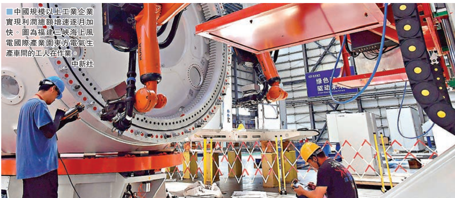
中國規模以上工業企業實現利潤總額逐月增加。圖為福建三峽海上風電國際產業園東方電氣生產車間的工人在作業。