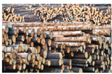
■加拿大是美國最大的木材供應國。

加拿大貿易部長伍鳳儀歡迎裁決，呼籲美國停止對加拿大木材加徵關稅。加拿大木材供應商代表也強調，美國關稅只會加劇美加兩地業界負擔。美國貿易