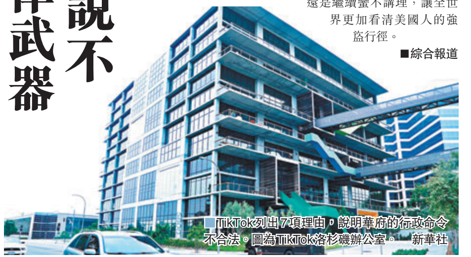
■TikTok 列出7項理由，說明華府的行政命令不合法。圖為TikTok 洛杉磯辦公室。新華社